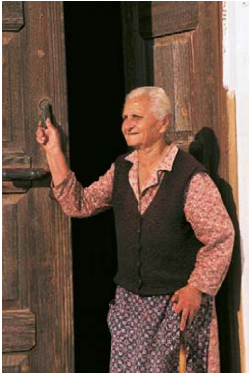
ΦΩΤ. Μ. ΠΟΡΝΑΛΗΣ

του Τρίκερι συνεχίζεται. Αφήνουμε τη δυτική πλευρά του Πύργου του Κουτμάνη και μέσα από ανηφορικά καλντερίμια φτάνουμε στην πολύ όμορφη εκκλησία των Αγίων Αναργύρων , τον δεύτερο- μετά την Αγία Τριάδα- σε μέγεθος ναό του Τρίκερι, με διαστάσεις 15,2 X 6,1 μέτρα. Είναι μονόκογχος ναός με περίσυλο νάρθηκα και ξυλόγλυπτο τέμπλο με πολλές εικόνες. Ένα μεγάλο φουντωτό κυπαρίσσι στον αύλειο χώρο συναγωνίζεται σε ύψος το πετρόχτιστο επιβλητικό κωδωνοστάσιο. Στον μεσημβρινό εξωτερικό τοίχο και