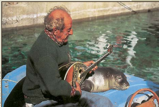
ΦΩΤ. Μ. ΠΟΡΝΑΛΗΣ

Στην Στενή Βάηλη Αθωννήσου με το φωκάκι "Θοδωρής".