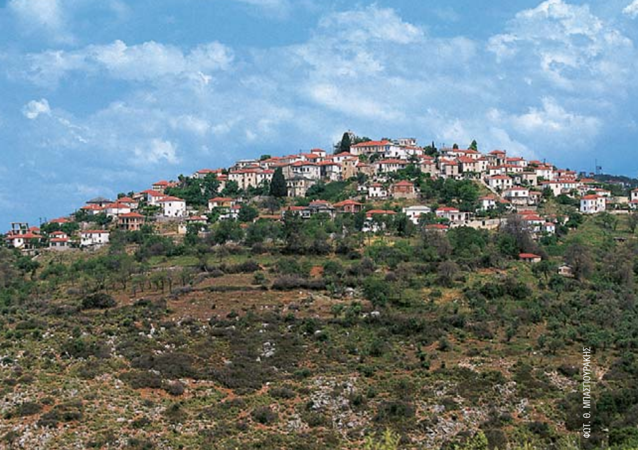
ΦΩΤ. Θ. ΜΠΑΣΠΟΥΡΑΚΗΣ

φρεσκα μελανούρια, λιθρίνια, γάυρο και μπακαλιάρο. Η ζήτηση είναι μεγάλη, όλοι σπεύδουν για να διαλέξουν τα καλύτερα. Η πλατεία είναι στρωμένη με μεγάλες ορθογώνιες πλάκες και ολόγυρά της είναι διατεταγμένα μικρομάγαζα, καφενεία και ταβερνάκια. Κάποια από αυτά χρονολογούνται από τα μέσα του 19ου αιώνα. Ίσως τότε πρωτοείδαν το φως και μερικές από τις ακακίες της πλατείας που κυριαρχούν σ' όλο το χώρο.