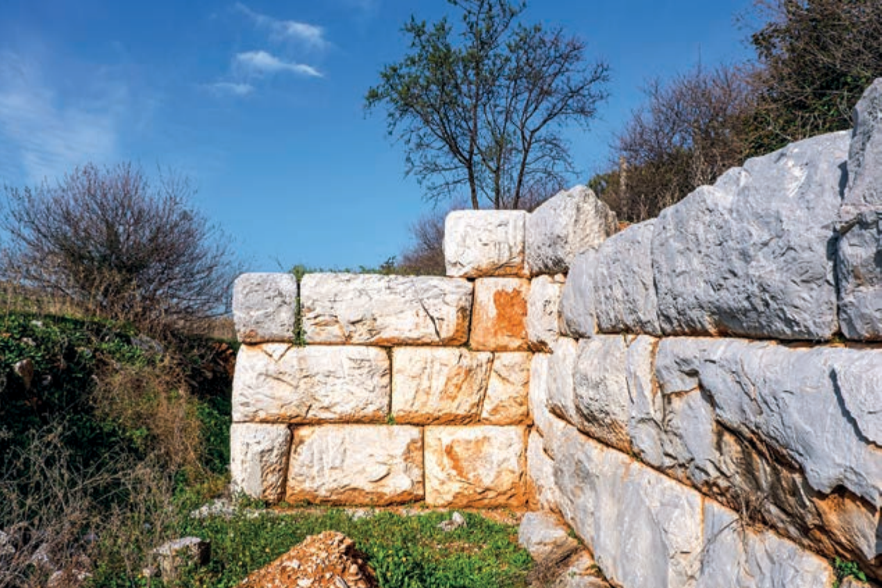
Το εξωτερικό τείχος της ακρόπολης.

Αυτά λένε οι έρευνες και όλες οι ενδείξεις, χωρίς εμείς να μπορούμε να έχουμε άποψη ή θέση επί του αρχαιογνωστικού θέματος.