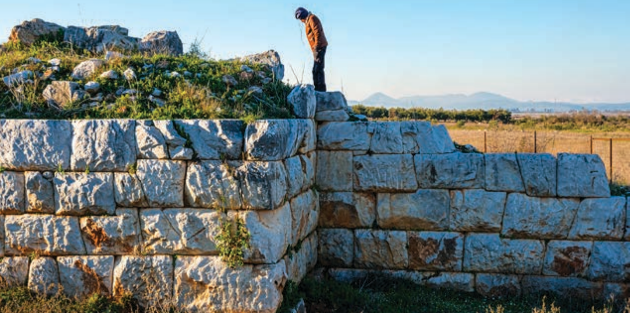
Σκαρφαλώνοντας στο τείχος της ΝΑ Πύλης.

Περνάμε απέναντι όπου είναι φραγμένη μια ιδιοκτησία και όπου τα βάτα και τα πουρνάρια έχουν σφραγισμένα τα λείψανα του τείχους. Από τη δυτική μεριά του κτήματος βρίσκουμε πέρασμα και ακολουθούμε τον υπερυψωμένο όχτο, ο οποίος έχει καλύψει την περιτείχιση της αρχαίας πόλης. Σε μικρή απόσταση τελειώνει ο όχτος κι αποκαλύπτεται μια θαυμάσια σειρά του αρχαίου τείχους που ακολουθεί ανατολική κατεύθυνση. Σε τριακόσια μέτρα από τον δρόμο Πλατάνου – Σούρπης πέφτουμε μπροστά σε μια περιφραγμένη έκταση ενός περίπου στρέμματος, μέσα στην οποία υψώνει εκρηκτικό ανάστημα η Νοτιοανατολική Πύλη, όπως λένε, της αρχαίας ακρόπολης.