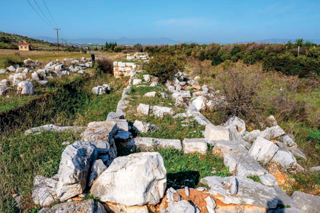
Μέρος του τειχίου της αρχαίας πόλης στον περίφρακτο αρχαιολογικό χώρο.