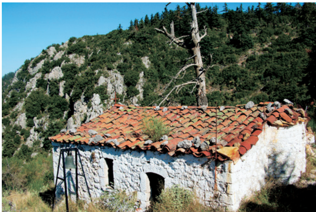
Το απέριττο εξωκκλήσι της Αγ. Μαρίας (άνω), πρώτος σταθμός της θαυμάσιας πεζοπορικής διαδρομής, που έχει κατάληξη στην "Παναγία του Κελλιού" (αριστερά).

Η ΠΕΖΟΠΟΡΙΚΗ ΔΙΑΔΡΟΜΗ ΣΤΗΝ ΑΓ. ΜΑΡΙΝΑ ΚΑΙ ΣΤΗΝ ΠΑΝΑΓΙΑ ΤΟΥ ΚΕΛΛΙΟΥ