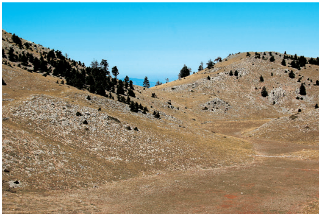
Στα ομαλά βοσκοτόπια της υποαλπικής ζώνης, καθ' οδόν προς την κορυφή του Ψαρή.

σημείο εξάπλωσής του στην Ελλάδα, ενώ κάποια μεμονωμένα άτομα έχουν παρατηρηθεί και στον Ταύγετο. Αναπτύσσεται σε ξηρά ασβεστολιθικά εδάφη και το ύψος του μπορεί να ξεπεράσει και τα 12 μέτρα! Τα σημεία διαφοράς του από τα υπόλοιπα είδη κέδρων είναι ο ογκώδης καρπός, ο ευθυτενής κορμός και η κωνοειδής μορφή. Οι τρεις παράλληλοι κορμοί οφείλονται στο γεγονός, ότι ο καρπός περιλαμβάνει μέσα του τρεις σπόρους. Παλιά χρησιμοποιείτο στη βαρελοποιία και σε κατασκευές ξυλόγλυπτων λόγω της αντοχής του. Στο Δάσος της Μαλεβής τελεί υπό καθεστώς απόλυτης προστασίας, ως είδος ιδιαίτερου κάλλους).