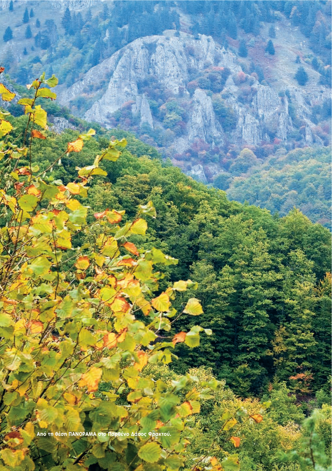
Από τη θέση ΠΑΝΟΡΑΜΑ στο Παρθένο Δάσος Φρακτού.