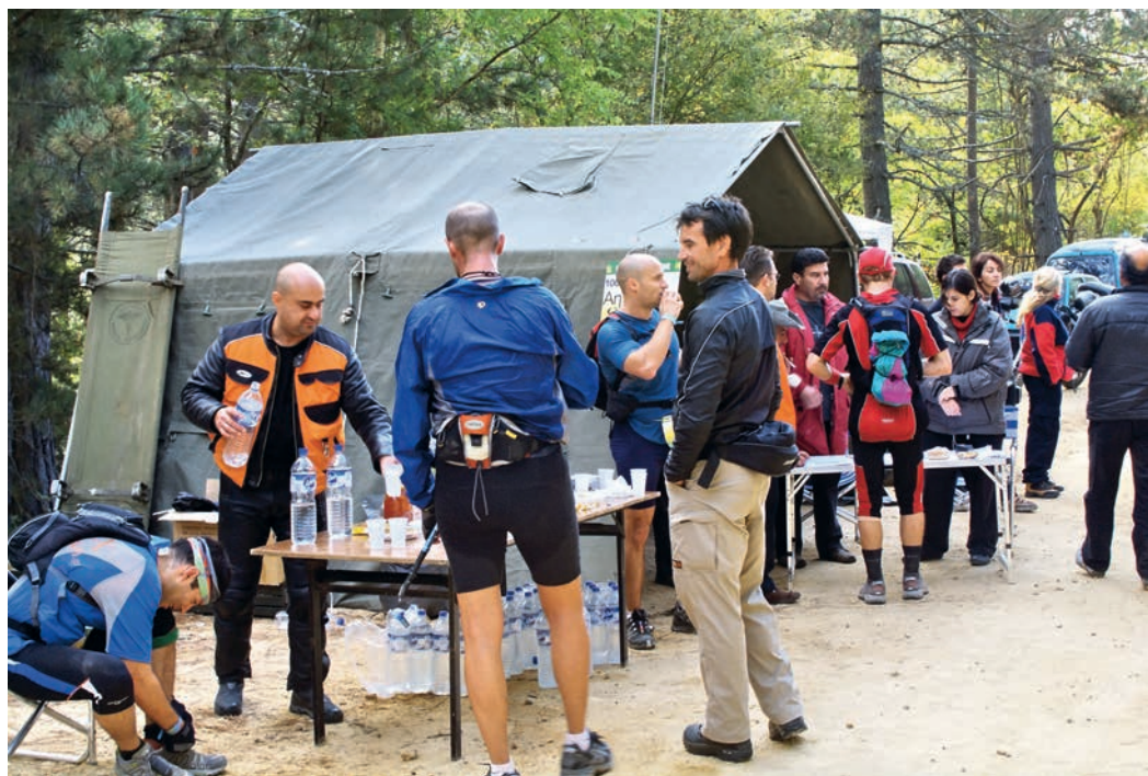
Σταθμός Αϊ-Γιάννη. Η οργάνωση του αγώνα ήταν υποδειγματική.