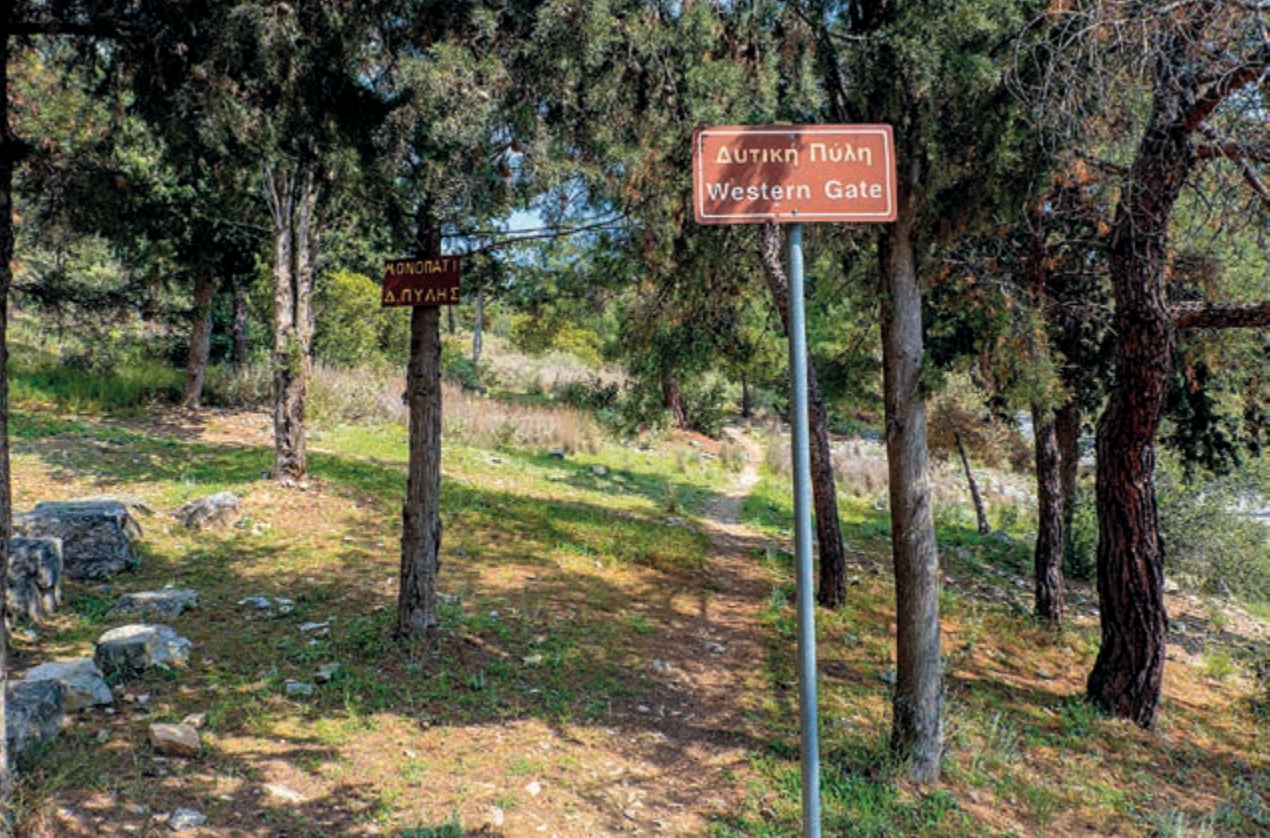
Το μονοπάτι εισόδου στη Δυτική Πύλη.