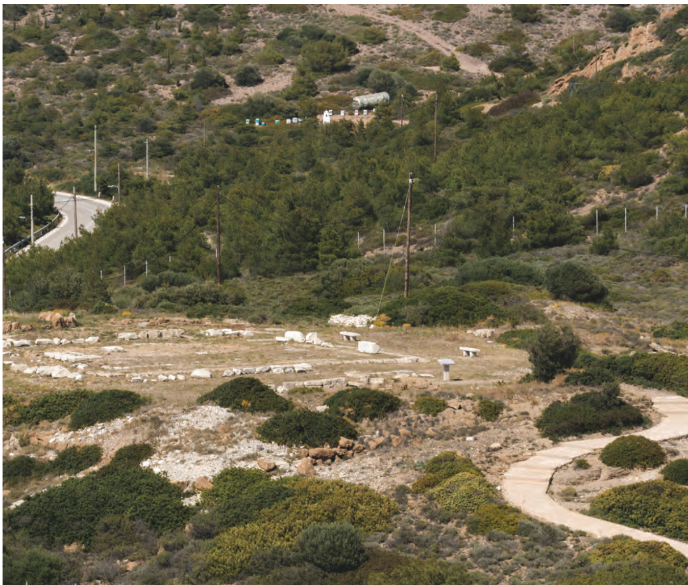
Η τοποθεσία του ιερού της Αθηνάς το οποίο μεταφέρθηκε κατά τη ρωμαϊκή εποχή στην αθηναϊκή αγορά

τους επισκέπτες δε μου επιτρέπουν να σταθώ πάνω στον στυλοβάτη του αρχαίου μνημείου, στο ψηλότερο δηλαδή σημείο του ακρωτηρίου, που κάπου διάβασα ότι βρίσκεται 73 μέτρα πάνω από το επίπεδο της θάλασσας. Από τη μία μεριά έχει ξαπλώσει στη θάλασσα