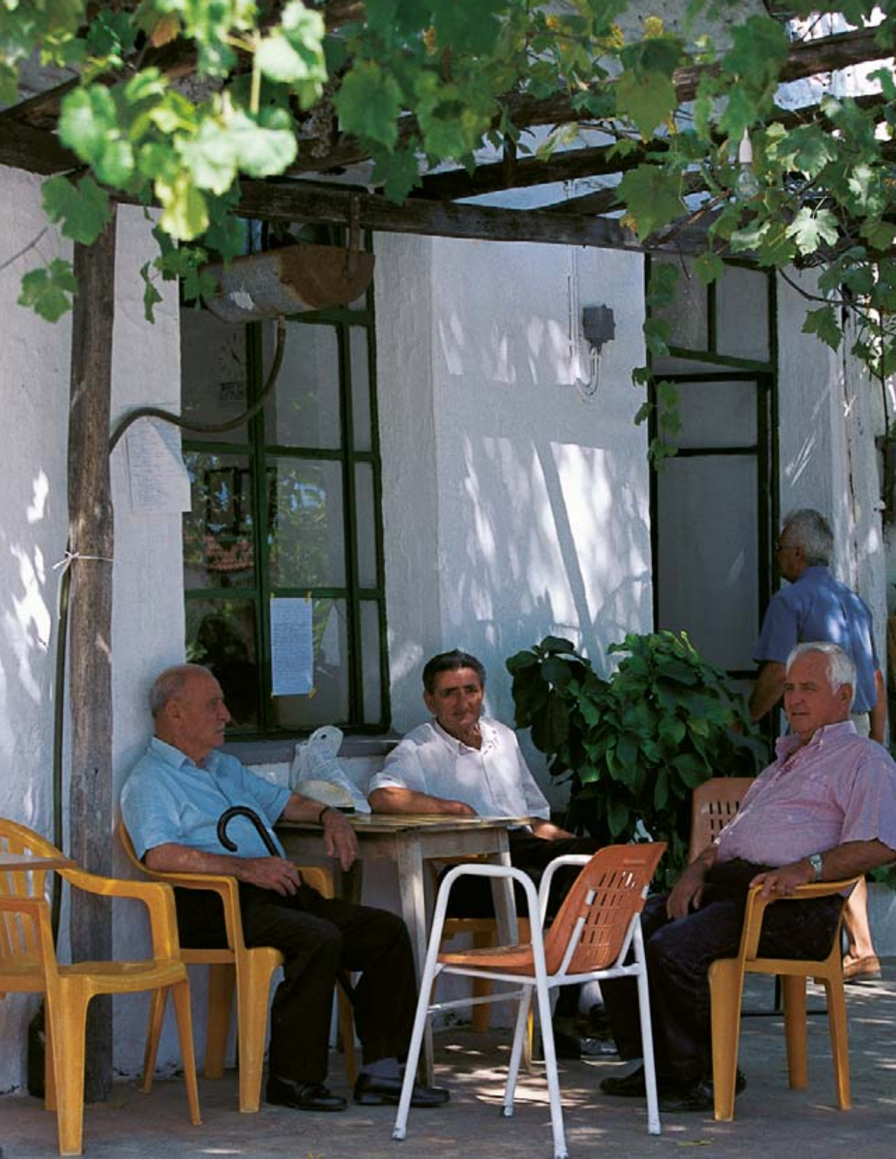
Στόμιο, καφενεδάκι της Κικής. Καθημερινή συγκέντρωση.