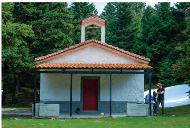
Το εκκλησάκι της Παλιοδρακοσπηλιάς, όπου γίνεται κάθε χρόνο το πανηγύρι των Σαρακατσαναίων.

Μαλιακού πάχυναν τις Θερμοπούλες κι έτσι τώρα έμοιαζε με απέραντη πεδιάδα που φάνηκε να πατιέται εύκολα. Περάσαμε έξω από την καινούργια, πελώρια κατασκευή της Μονής του Αγίου Νικολάου χαμηλώνοντας αρκετά. Ένας «εφιάλτης» γεννιόταν μέσα μας μα όχι όπως ο αρχαίος. Ένας Εφιάλτης από την ανάποδη.