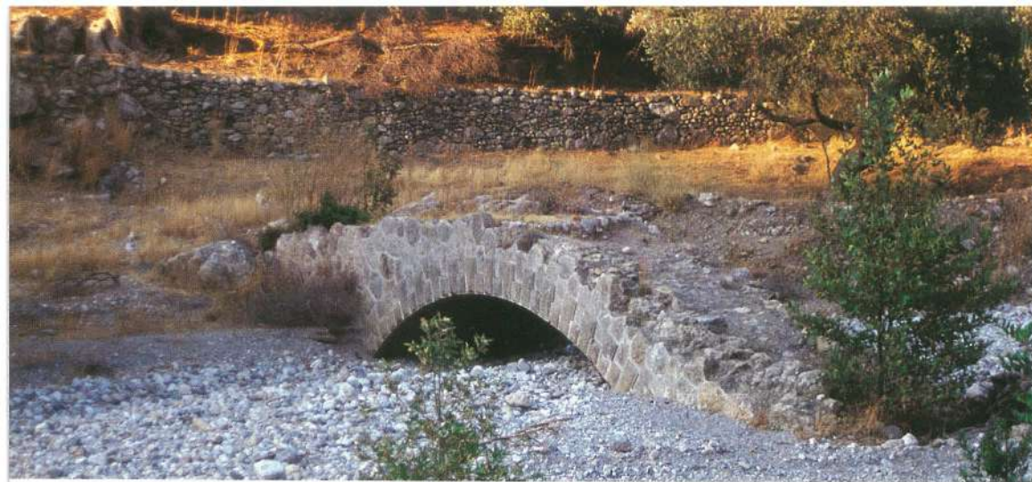
Παλιό μονότοξο γεφύρι, που προσχώθηκε από τη διαβρωτική δράση του χειμάρρου.

μικρά, που μάλλον αναζητούσαν ένα σκιερό και ήσυχο μέρος για να αποφύγουν την καλοκαιρινή ζέση. Η ξαφνική παρουσία μας, τα ανάγκασε να φύγουν γρήγορα ανηφορίζοντας σε κατορθάχαλα βράχια με αξιοθαύμαστη ευλυγισία. Το αγρίμι ή αίγαγρος της Κρήτης ( Capra aegagrus cretensis ) ζώο-σύμβολο της κρητικής περηφάνειας και ελευθερίας, ζει στα απόκρημνα μέρη των Λευκών Ορέων και πρόκειται για ένα σπάνιο υποείδος του ασιατικού αγριοκάτσικου. Μιά τέτοια συνάντηση αποζημώνει και για τη μεγαλύτερη κούραση από την πορεία. Εκτός από το αγρίμι και άλλα ζώα βρίσκουν τροφή και καταφύγιο στο φαράγγι. Ο γυπαιτός, ένα σπάνιο αρπακτικό, ο χρυσαετός, το αγριοπερίστερο, το πετροχελιδόνι, ο άρκαλος (κρητικός ασβός), διάφορα μικρά θηλαστικά και ερπετά, καθώς και νυχτερίδες στις σπηλιές κάνουν το φαράγγι έναν ενιαίο ζωντανό οργανισμό.