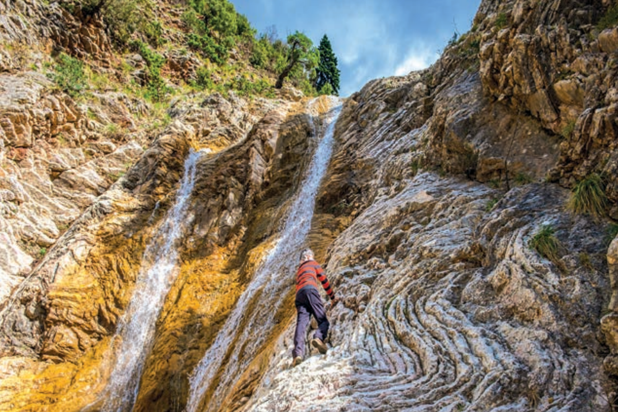
Ο διπλός καταρράκτης στη Ζουγκίτσα.

γκεντρώθηκε σιγά-σιγά όλο σχεδόν το στράτευμα. Ο αρχηγός κάλεσε όλους τους καπεταναίους στο γιατάκι του, για να συσκεφθούν σχετικά με την απάντηση που θα έδιναν στο γράμμα των Τούρκων για ειρήνη.