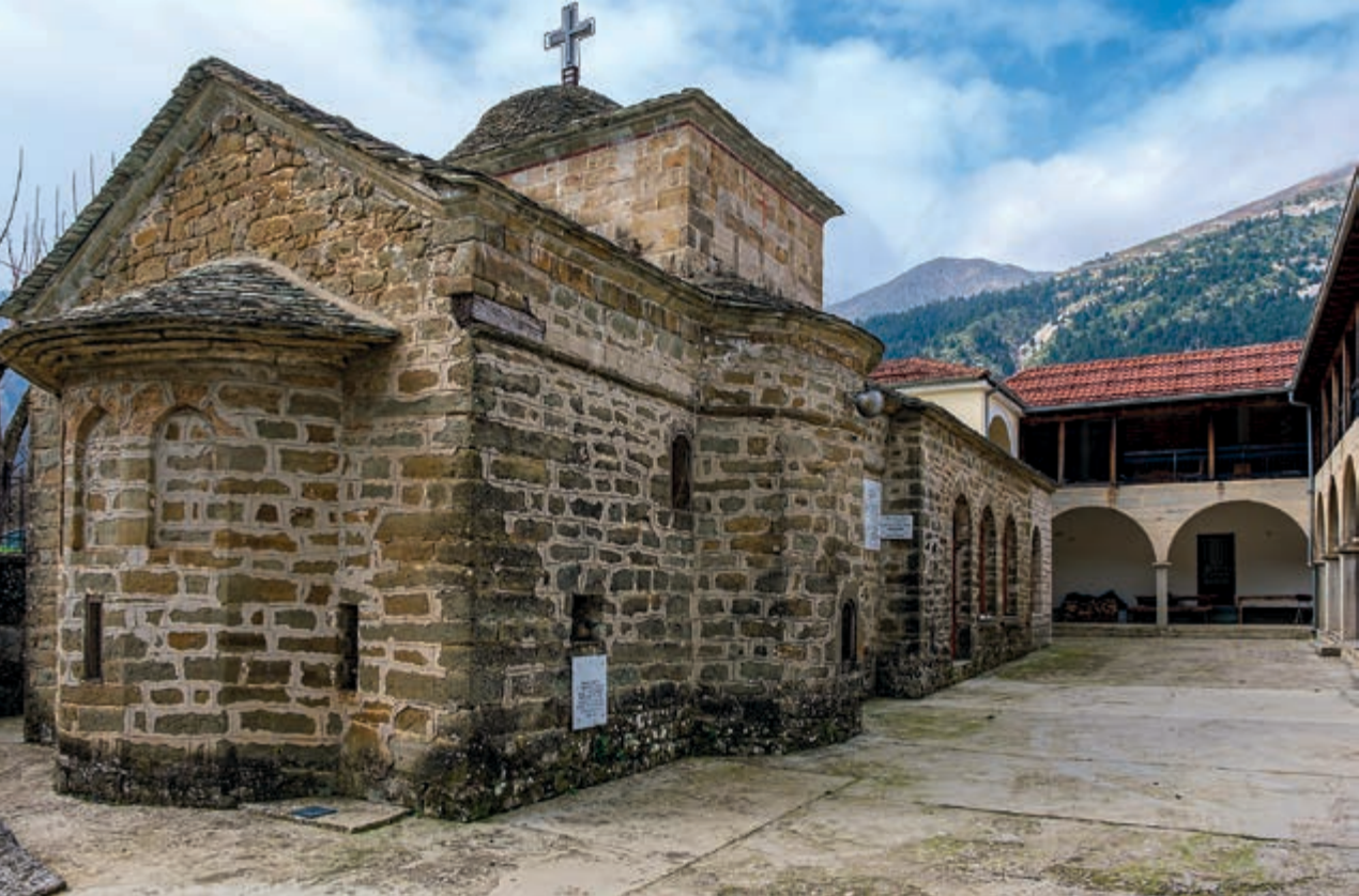
Η μονή της Αγίας Τριάδας όπως είναι σήμερα και ο νάρθηκας του ναού.