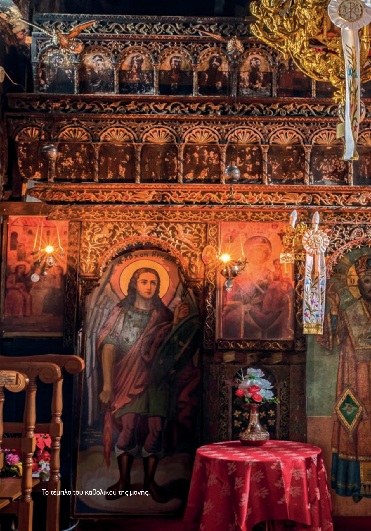
Το τέμπλο του καθολικού της μονής.