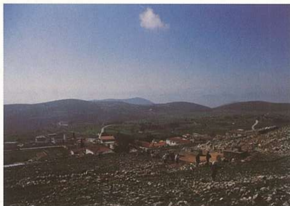
Ανηφορίζοντας από το χωριό Στεφάνι, ακολουθώντας την διαδρομή του Νικηταρά.

Τα εργαλεία που μπορεί κανείς να χρησιμοποιήσει σ' αυτήν την διαδικασία είναι πολλά και ποικίλουν από το απλό ταξιδιωτικό σημειωματάριο, μέχρι την ταξιδιωτική μυθιστορία στοχασμού και από την πολιτική δημηγορία της