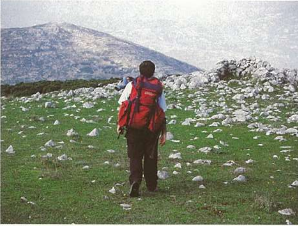
Στο μικρό οροπέδιο Γούπατα, κάτω από την Ψηλή Ράχη. (υψόμετρο 1.078 μ.)

γιο) γιορτάζει στις 23 Αυγούστου, οπότε και πλήθη πιστών συρρέουν για να προσκυνήσουν την θαυματουργή εικόνα.