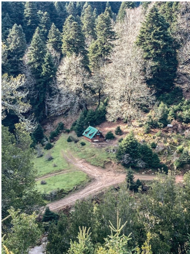
Το καταφύγιο του Πετροκάναλου και η πηγή του.