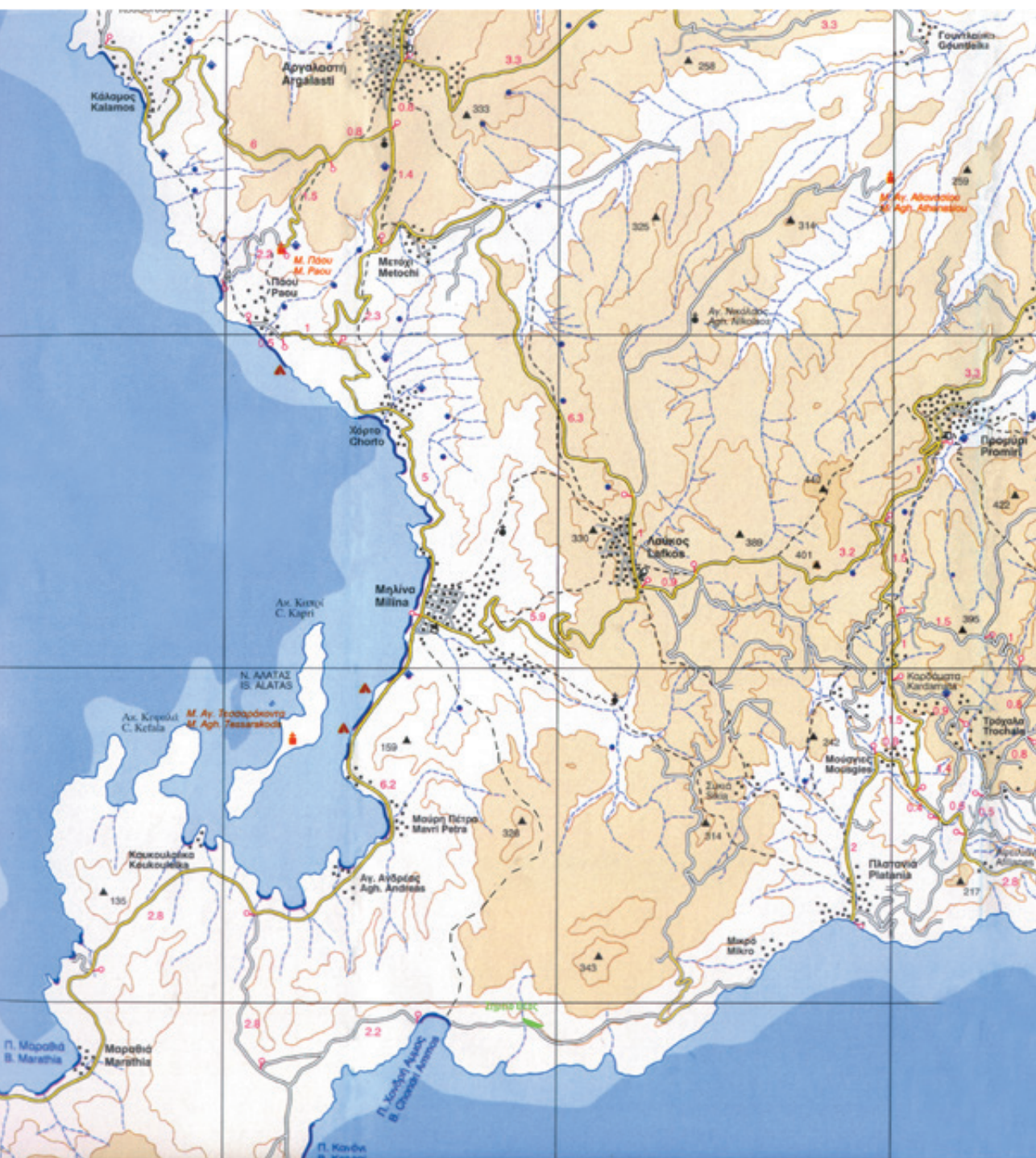
Χάρτης Πηλίου των Road Editions