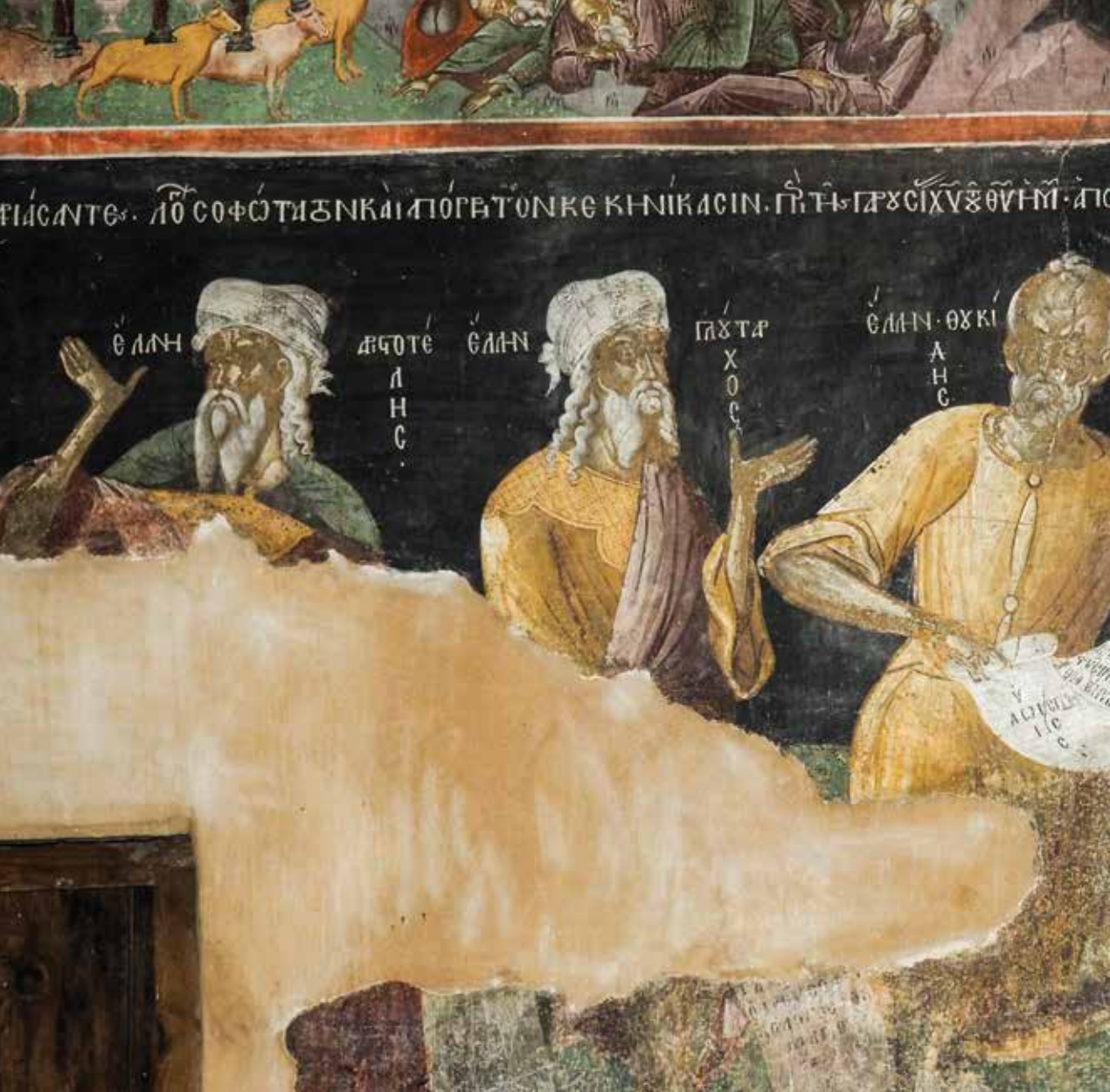
Μονή Αγίου Νικολάου Φιλανθρωπινών στο νησί της λίμνης Παμβώτιδας.

Στο μικρό νησί χωρίς όνομα, στο κέντρο της λίμνης Παμβώτιδας, σε απόσταση μόνο 10 λεπτών με το καραβάκι από την πόλη των Ιωαννίνων, δεσπόζει η Μονή του Αγίου Νικολάου των Φιλανθρωπινών, το σημαντικότερο μεταβυζαντινό μοναστήρι της Ηπείρου, που ευεργετήθηκε από την ομώνυμη αριστοκρατική οικογένεια, στην οποία χρωστά και το όνομά του. Το καθολικό του είναι διακοσμημένο