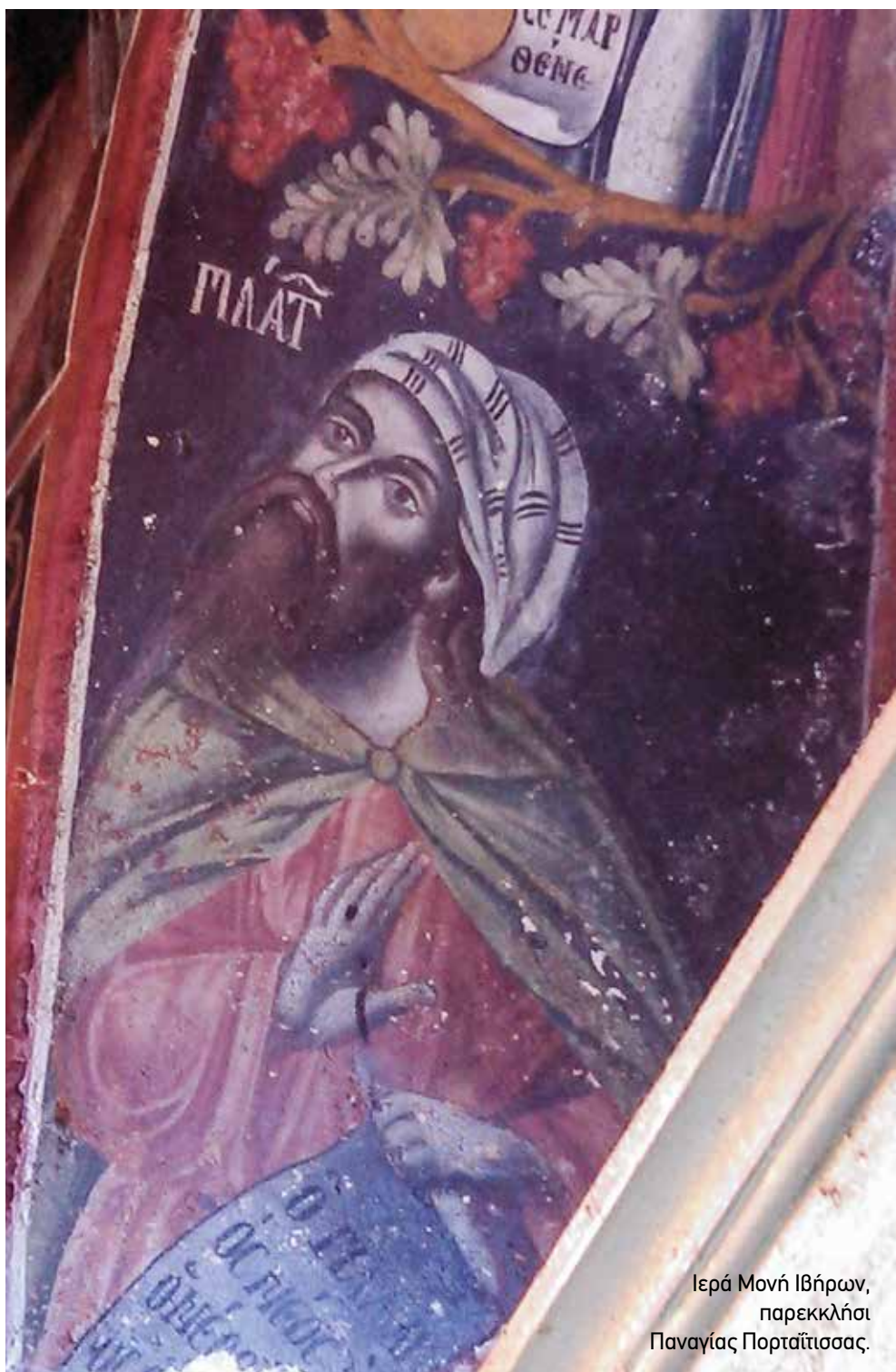
Ιερά Μονή Ιβήρων, παρεκκλήσι Παναγίας Πορταϊτίσσης.