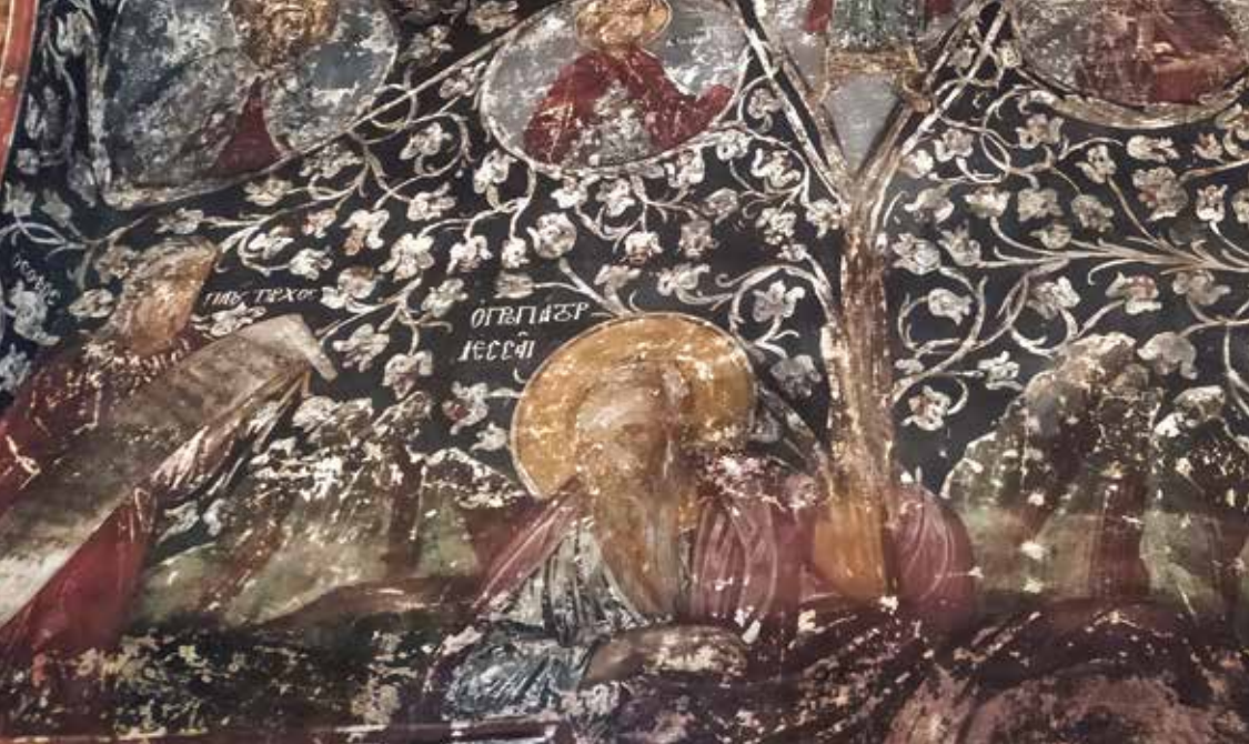
Παράσταση της Ρίζας του Ιεσσαί στη Σιάτιστα.

καθώς και με τις ιδέες του Διαφωτισμού, γενόμενοι ουσιαστικά φορείς τους και διαμορφώνοντας έτσι τη μεγάλη Νεοελληνική Αναγέννηση.