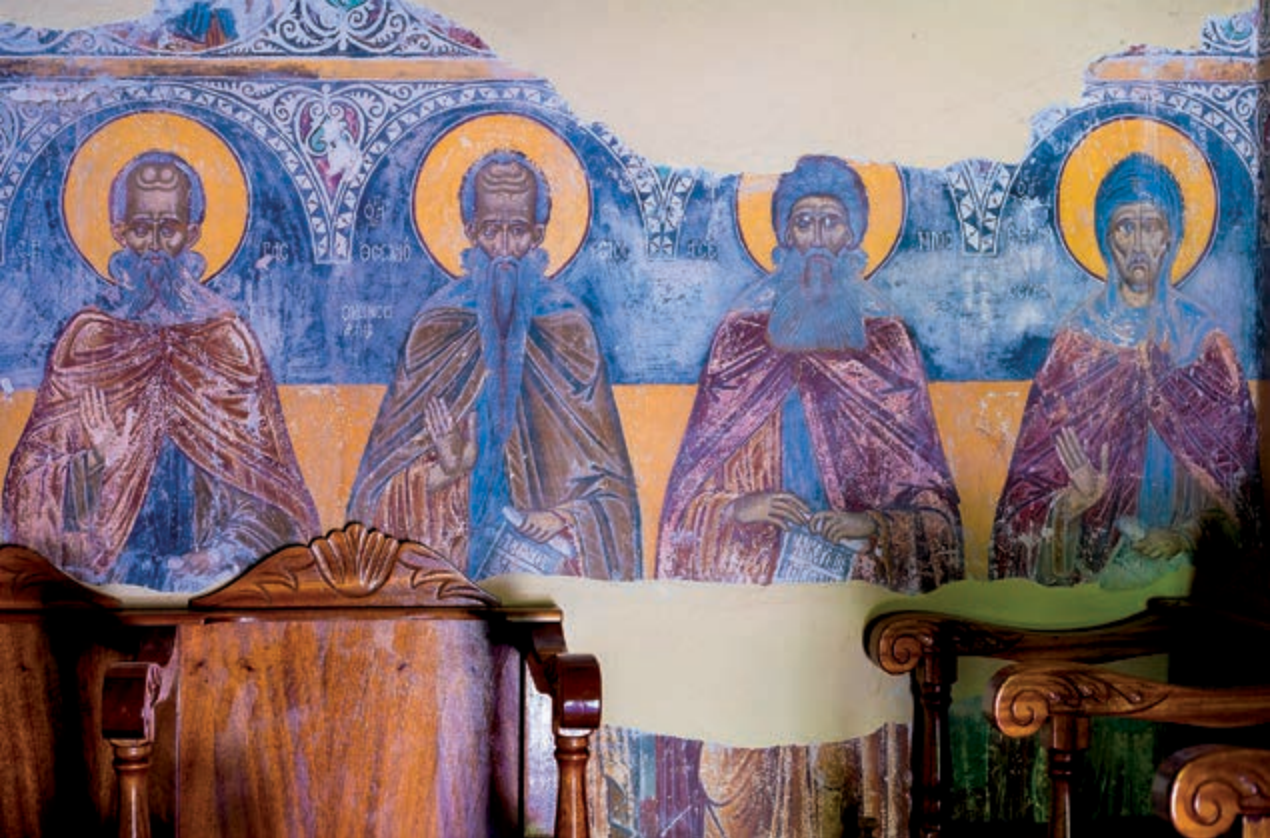
Τοιχογραφίες στην Ι. Μ. Αγίας Τριάδας Σπαρμού.

περιμένουν τον Αύγουστο για να ζωντανέψουν από τις χαρούμενες φωνές των επισκεπτών, που γυρίζουν στον γενέθλιο τόπο για να ψηλαφήσουν τις ρίζες τους, να πάρουν δυνάμεις και να επιβεβαιώσουν αυτή την αίσθηση του «ανήκειν» σε μια κοινότητα με κοινή προέλευση κι αξίες. Ή έστω την ψευδαίσθηση.