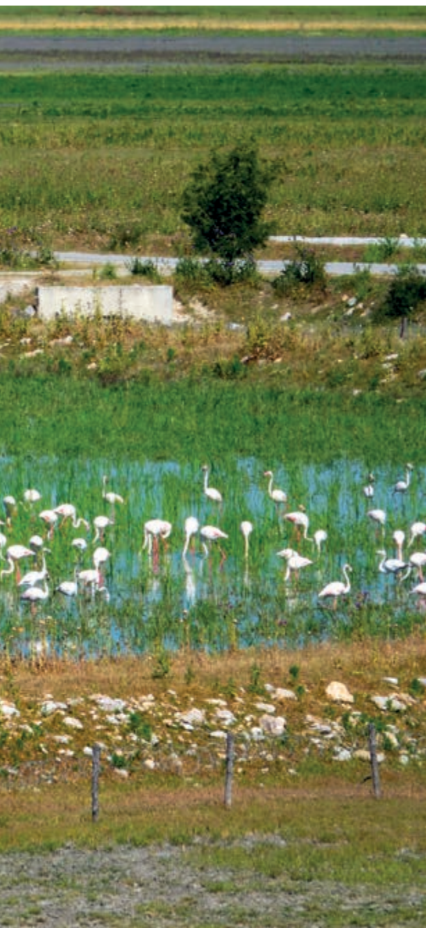
Φλαμίγκο τρέφονται στα πλημμυρισμένα λιβάδια της ανασυσταθείσας Κάρλας.