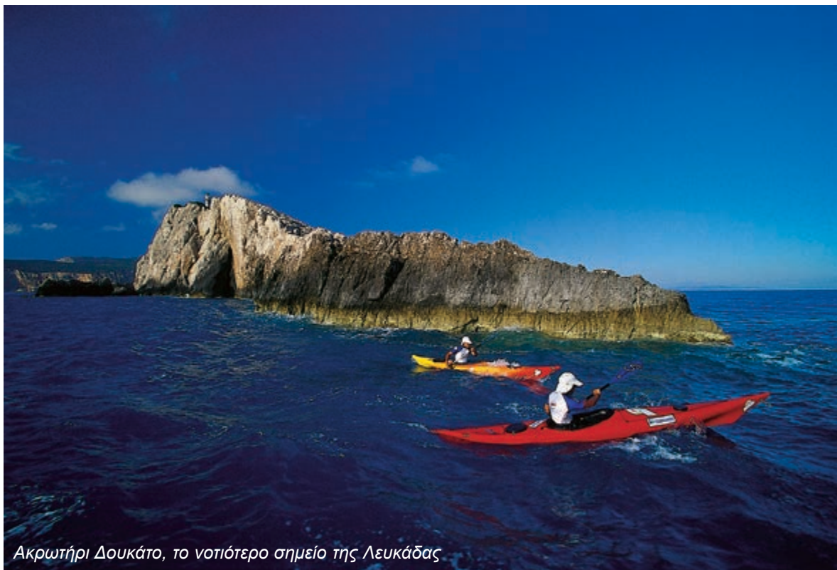
Ακρωτήριο Δουκάτο, το νοτιότερο σημείο της Λευκάδας

Φισκάρδο: Άριστη αναλογία παραδοσιακού και κοσμοπολίτικου, το γραφικό λιμανάκι σε κερδίζει από την πρώτη κιόλας ματιά.