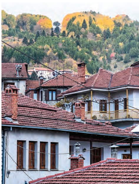
Μέσα από τις στέγες των σπιτιών βλέπουμε στο βάθος το χιονοδρομικό Καρακόλι

τον Μετσοβίτικο ποταμό, στα δεξιά μας, σε κοντινή απόσταση, βρίσκεται η Ιερά Μονή Κοιμήσεως της Θεοτόκου, η ανέγερση της οποίας χρονολογείται το 1754. Ο ναός είναι αγιογραφημένος και ιδιαίτερο ενδιαφέρον παρουσιάζει το ξυλόγλυπτο τέμπλο του. Περνώντας τη μεταλλική γέφυρα, στο 2ο κλμ. της διαδρομής, αρχίζουμε το ανέβασμα μέσα από λιβάδια όπου τις παλιές εποχές οι άνθρωποι καλλιεργούσαν κυρίως δημητριακά, για να μπορέσουν να ζήσουν. Σε όλη την περιοχή θα παρατηρήσουμε στιβαρές κατασκευές, διαδοχικά φράγματα στο ποτάμι και τοίχους αντιστήριξης, που έγιναν τις δεκαετίες του 1950 και του 1960. Την ίδια εποχή έγιναν και δεντροφυτεύσεις σε μεγάλη έκταση. Όλα αυτά με πρωτοβουλία του Ευάγγελου Αβέρωφ με σκοπό την προστασία της περιοχής από κατολισθήσεις, τη δημιουργία θέσεων εργασίας για αρκετά χρόνια και την αισθητική αναβάθμιση του τόπου. Συμπληρώνοντας τέσσερα χιλιόμετρα, η διαδρομή αρχίζει να γίνεται ομαλή και σταδιακά περνά μέσα σε δάσος