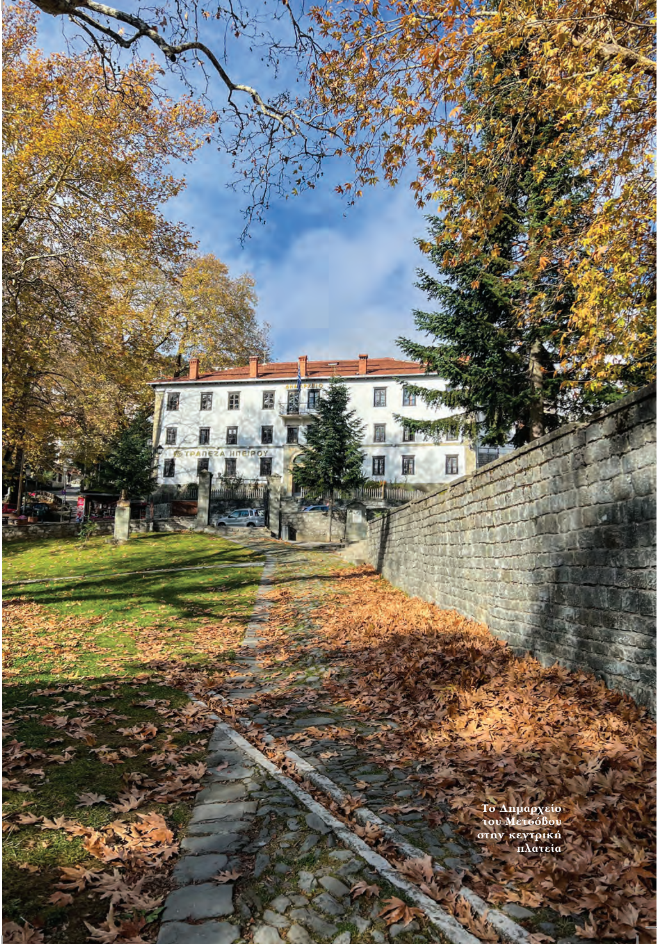
Το Δημαρχείο του Μετσόβου στην κεντρική πλατεία