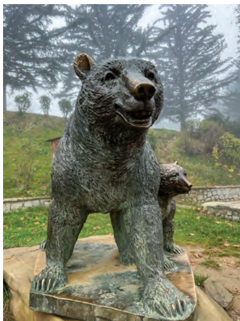
Η αρκούδα σήμα κατατεθέν του Μετσόβου αλλά και του αγώνα

τον Μετσοβίτικο ποταμό, στα δεξιά μας, σε κοντινή απόσταση, βρίσκεται η Ιερά Μονή Κοιμήσεως της Θεοτόκου, η ανέγερση της οποίας χρονολογείται το 1754. Ο ναός είναι αγιογραφημένος και ιδιαίτερο ενδιαφέρον παρουσιάζει το ξυλόγλυπτο τέμπλο του. Περνώντας τη μεταλλική γέφυρα, στο 2ο κλμ. της διαδρομής, αρχίζουμε το ανέβασμα μέσα από λιβάδια όπου τις παλιές εποχές οι άνθρωποι καλλιεργούσαν κυρίως δημητριακά, για να μπορέσουν να ζήσουν. Σε όλη την περιοχή θα παρατηρήσουμε στιβαρές κατασκευές, διαδοχικά φράγματα στο ποτάμι και τοίχους αντιστήριξης, που έγιναν τις δεκαετίες του 1950 και του 1960. Την ίδια εποχή έγιναν και δεντροφυτεύσεις σε μεγάλη έκταση. Όλα αυτά με πρωτοβουλία του Ευάγγελου Αβέρωφ με σκοπό την προστασία της περιοχής από κατολισθήσεις, τη δημιουργία θέσεων εργασίας για αρκετά χρόνια και την αισθητική αναβάθμιση του τόπου. Συμπληρώνοντας τέσσερα χιλιόμετρα, η διαδρομή αρχίζει να γίνεται ομαλή και σταδιακά περνά μέσα σε δάσος