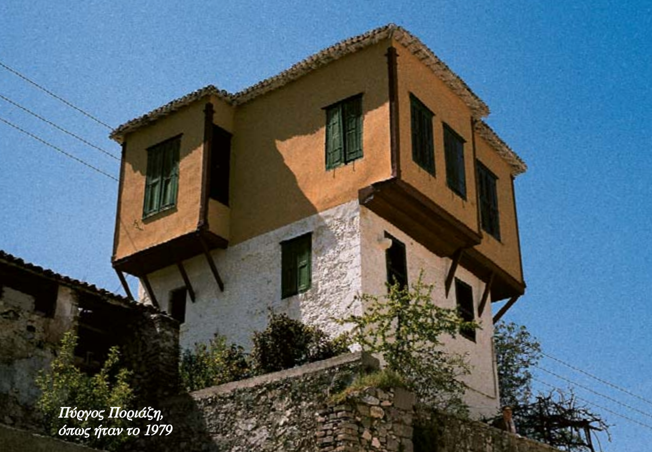
Πύργος Ποριάζη, όπως ήταν το 1979