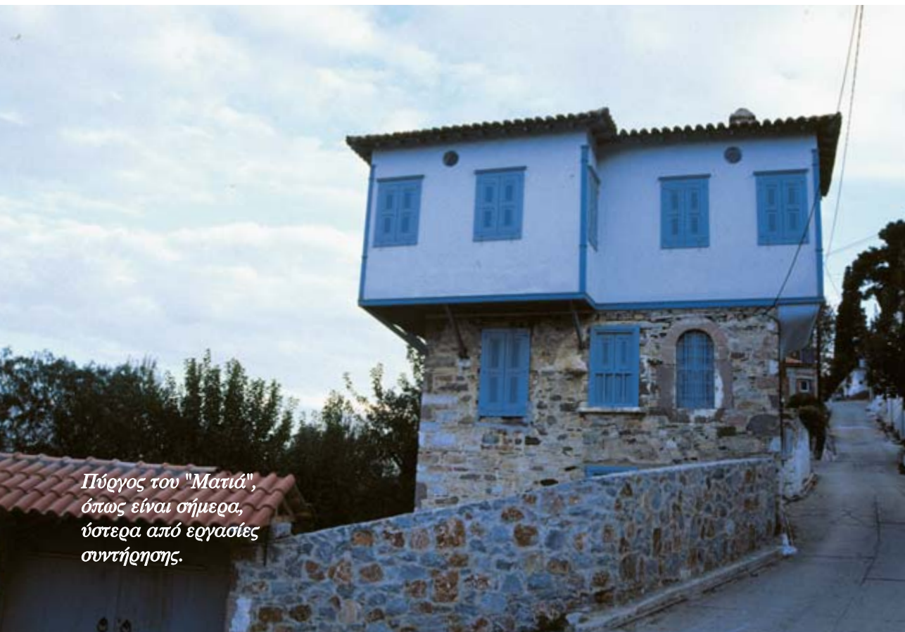
Πύργος του "Ματιά", όπως είναι σήμερα, ύστερα από εργασίες συντήρησης.