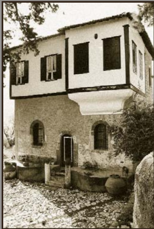
Η ΒΑ όψη του πύργου του "Κούμπα" που βρίσκεται ακόμα στον οικισμό Ακρωτήρι, προάστιο της πόλης της Μυτιλήνης (αριστερά) και (δεξιά) η ανατολική όψη του πύργου του "Αλαμανέλλη", που υπάρχει ακόμα στη θέση "Παναγιά Τρουλωτή", του οικισμού "Πύργων Θεομής", του Δήμου Λουτροπόλεως Θεομής.

ουσιαστικά οδηγούν στον αφανισμό τους και εντοπίζονται επιγραμματικά στη διαπίστωση ότι, "τα κτίρια αυτά, δεν εξυπηρετούν πια τις σημερινές ανάγκες διαβίωσης". Όμως, αν και αυτό περιέχει δόση αληθείας, εντούτοις, τα κτίσματα αυτά είναι σε θέση να εξυπηρετήσουν και τις πιο σύγχρονες παραθεριστικές απαιτήσεις, αρκεί να κατανοήσουμε, ότι τα υλικά και η τυπική μορφή της αρχιτεκτονικής των Πύργων, είναι αφ' εαυτού τους οικολογικά και βιοκλιματικά.