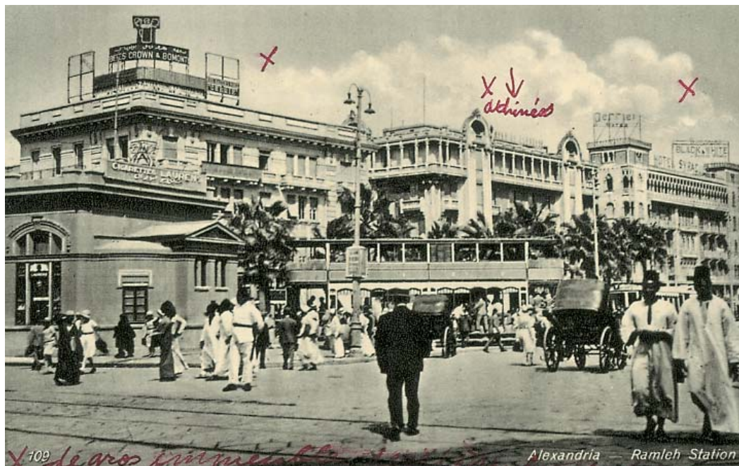
Ο σταθμός του Ραμλίου, ένα από τα πιο πολυσύχναστα μέρη της Αλεξάνδρειας σε καρτ ποστάλ των αρχών του 20ου αι.

δοχεία της πόλης. Το γοητευτικό "Μετροπόλ", ελληνικής ιδιοκτησίας κάποτε (σήμερα ανήκει στην αλυσίδα Paradise Inn, όπως και το αριστοκρατικό Windsor Palace ή το μοντέρνο Maamoura) και το φημισμένο "Σέσιλ" (σήμερα ανήκει στην αλυσίδα "Novotel"). Έκλεισα το πρώτο μου βράδυ στην Αλεξάνδρεια απολαμβάνοντας ένα ποτό στο ατμοσφαιρικό Monty's Bar που βρίσκεται στον ημιώροφο του "Σέσιλ". Εκεί συνήθιζε να πίνει και ο στρατηγός Μοντγκόμερι. Ο θρύλος της περιφημής μάχης του Ελ - Αλαμίν, ο Monty, χαϊδευτικά, ήταν θαμώνας του "Σέσιλ", όπως και πάρα πολλοί άλλοι ημίθεοι της τέχνης και της πολιτικής.