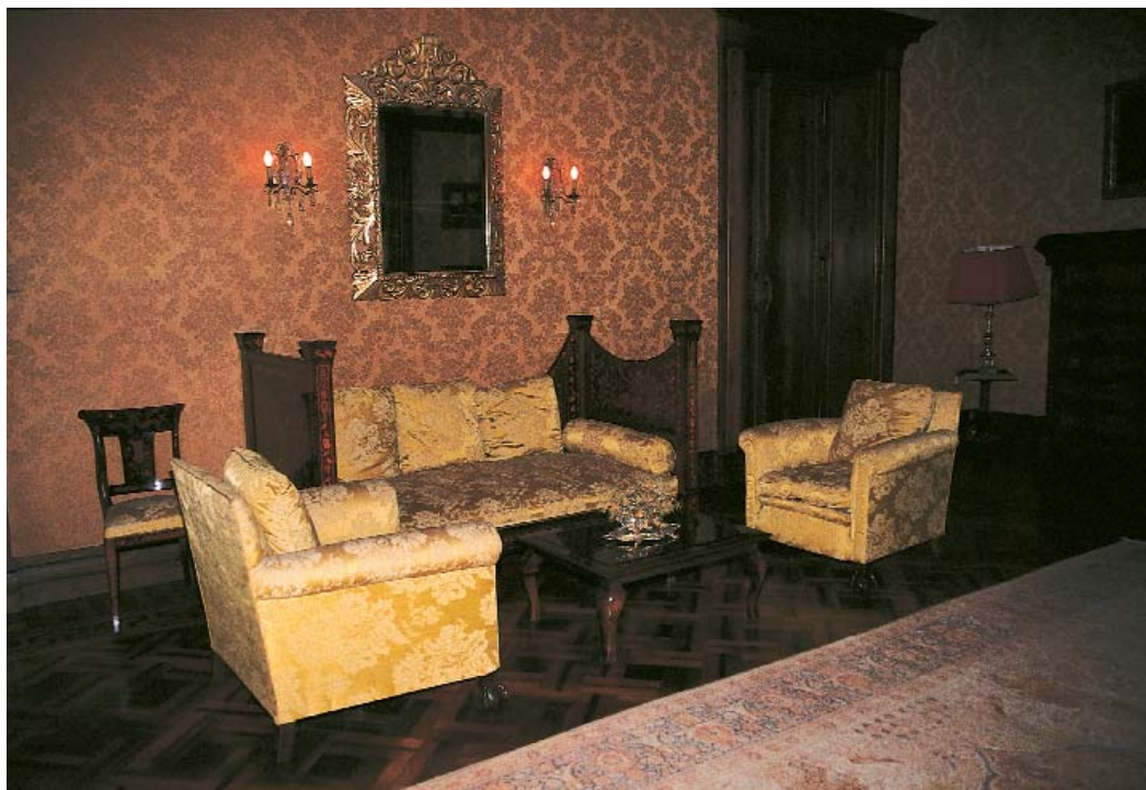
Ένα από τα πολλά ατμοσφαιρικά σαλόνια της οικίας Βολανάκη, που σήμερα αποτελεί την προξενική κατοικία.

ξυσιτών και των εργολάβων! Κτίσθηκαν και συνεχίζουν να κτίζονται με αμείωτο ρυθμό εκατομμύρια μικρά, ανήλια διαμερίσματα σε πολυκατοικίες που θα έπρεπε να είναι πενταόροφες και είναι εικοσαόροφες.