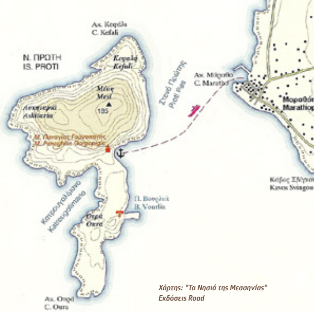
Χάρτης: "Τα Νησιά της Μεσσηνίας" Εκδόσεις Road

Απέναντι: Ο στενός και απόκρημνος όρμος "Το αυλάκι του Κατούλια" βρίσκεται δυτικά, ακριβώς αντίθετα με το Γραμμένο. Αυτό τον όρμο χρησιμοποιούσε ως αραξοβόλι και ορμητήριο ο πειρατής για τις νυχτερινές εξορμήσεις του στο Γραμμένο.