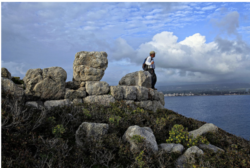
Η απόκρημη πλαγιά με τον αρχαίο πύργο, αληθινός βιγλάτορας πάνω από την παραλία της Βουρλιάς.