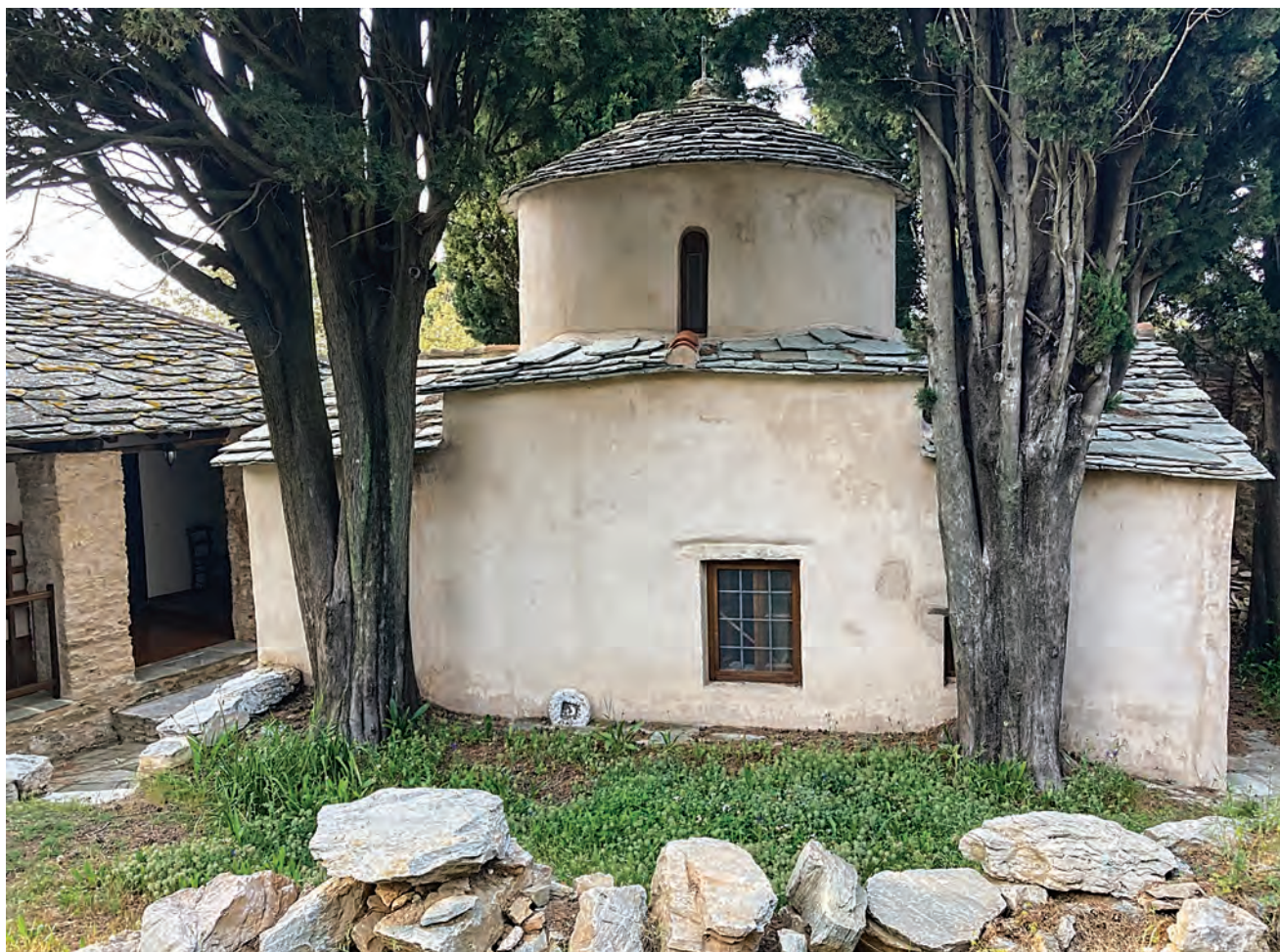
Η μονή των Ταξιαρχών. Μικρή, περιποιημένη, στα μέτρα του ανθρώπου

στον φούρνο, με χοιρινό, με κοτόπουλο, με ροφό, με επικάλυψη σοκολάτας, μαρμελάδα, λικέρ... Τα δαμάσκηνα Σκοπέλου διακρίνονται σε τρία είδη: το αυγάτο, το ξινό για το μαγείρεμα, καθώς και τη φημισμένη γαλλική ποικιλία Αζάν, δαμάσκηνο μαύρο, χυμώδες και γλυκό, από τη γαλλική πόλη Αζεν, που λένε ότι μεταφέρθηκε στο νησί μέσα σε μια πατάτα. Σήμερα η τουριστική ανάπτυξη του τόπου έφερε τα δαμάσκηνα στο περιθώριο. Χρόνια έχουν ν' ανάψουν οι ξυλόφουρνοι αποξήρασης στα καλύβια, περιμένουν στάσιμες οι λιάστρες καμωμένες από σπάρτα. Ωστόσο, όπου κι αν περιπλανηθείς, θα βρεις