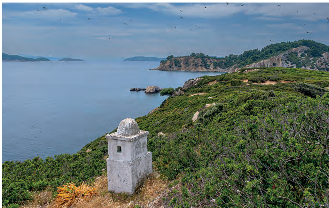
Εικόνες από το ύψωμα στο Ρέπι