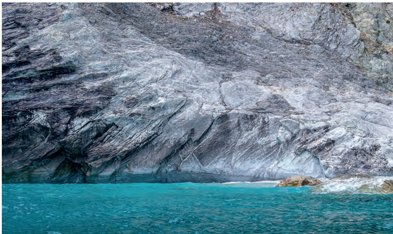
Όψεις της «Σκοτεινής Σπηλιάς»