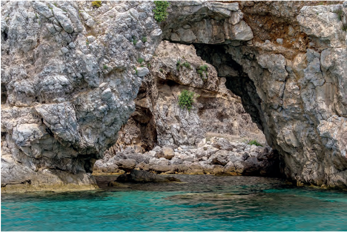
Η σπηλιά στην άκρη της Πούντας που περιγράφει ο Παπαδιαμάντης

φυτεμένες ανάμεσα στα πεύκα. Αναζητήσαμε τη σπηλιά της Μοσχούλας, τη σπηλιά του ερωτευμένου Αλέξανδρου, τη στριφτή εκείνη βραχότρυπα με την τρύπια οροφή και τον θεσπέσιο βυθό, όπου κολυμπούσε μισόγυμνη η ελκυστική κοπελούδα ως μια ρόδινη νέφωση του ονείρου. Πλησιάσαμε τη σπηλιά. Και βρεθήκαμε κάτω από μια στεφάνη άγριων βράχων που σκέπαζε το μικρό σπηλιαράκι προστατεύοντάς το. Ω, τι θαύμα ήταν αυτό. Δεν είχε άδικο ο μάστορας της γλώσσας να το παινεύει, με τόσα μαγικά φίλτρα ντυμένο. Ύστερα ξανοιχτήκαμε για τα καλά στο πέλαγο. Διαπλεύσαμε κι άλλο ένα στενό, αυτό της Ασπρονήσου. Η Ασπρονήσος, μια ογκώδης και αθέατη από τη Σκιάθο βραχονησίδα, στέκει κυματοθραύστis ως το βορειότερο νησί,