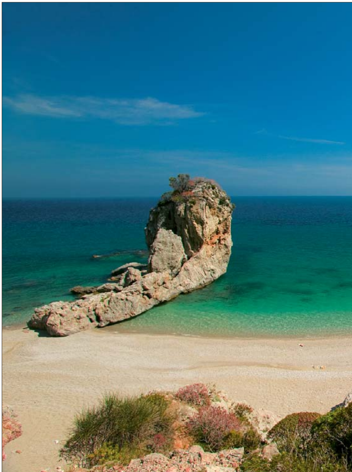
"Καλίμι" . Παραλία μοναχική,