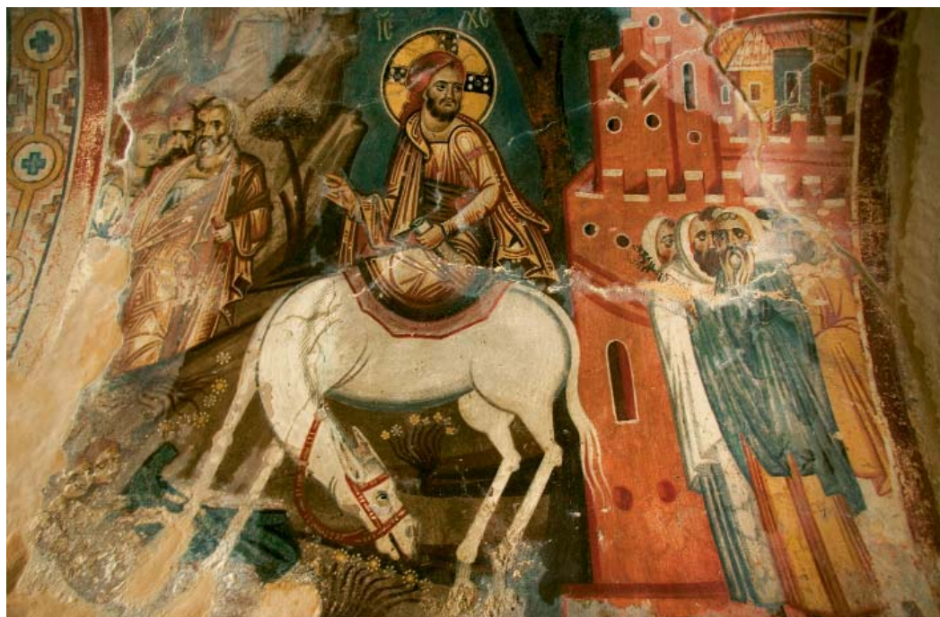
Τοιχογραφία από τον ναό της Μεταμόρφωσης του Σωτήρος στο “Ωρολόγι”. Το μεγαλύτερο ελαιόδεντρο στον Δήμο Αυλώνας, έξω από τον Αγ. Γεώργιο, με τεράστια κουφάλα και περίμετρο κορμού 8,5μ!