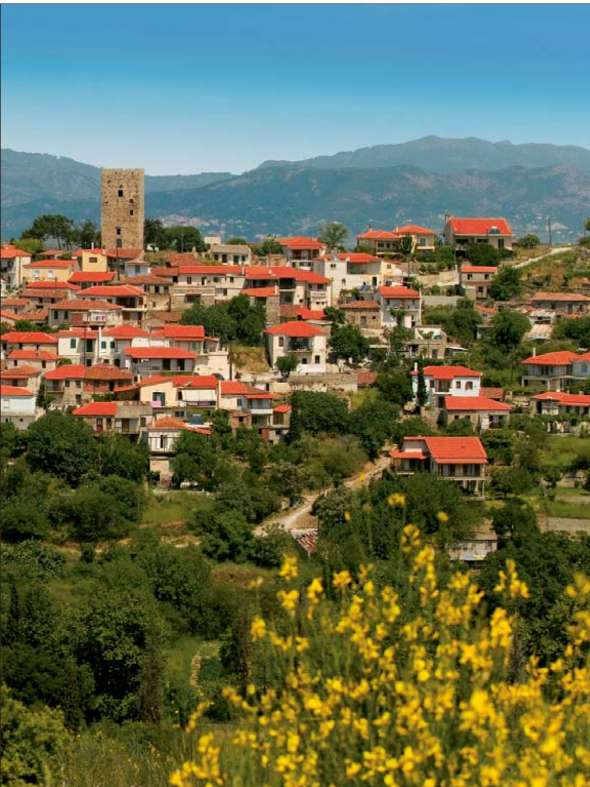
σημείο της γραφικής πολιτείας του Αυλωναρίου δεσπόζουν ο Ενετικός Πύργος και ο Αγ. Νικόλαος.