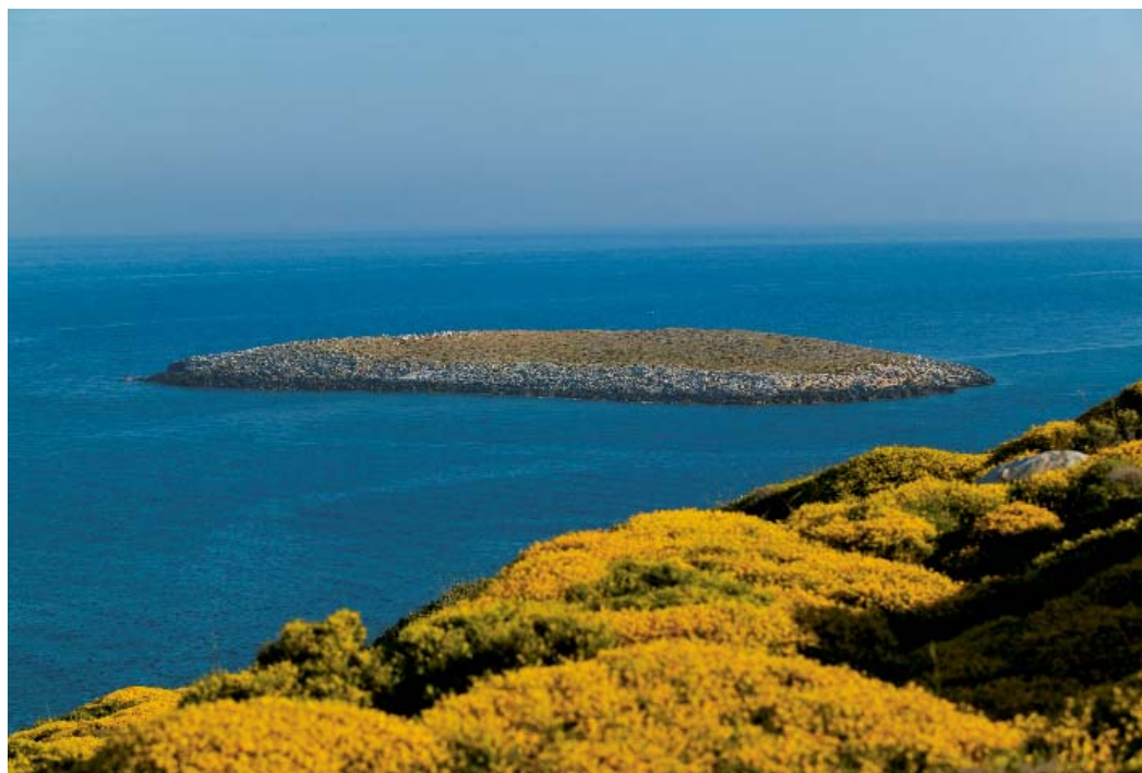
"Καρβουννήσι", μια έρημη νησίδα ανοιχτά του ακρωτηρίου της Πούντας.

χής και δεν αρνείσαι χάρες στους ανθρώπους.