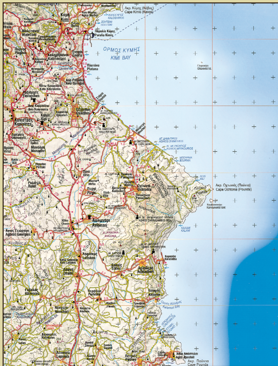
Τμήμα από τον χάρτη “ΝΟΤΙΑ ΕΥΒΟΙΑ” 1 : 100.000 των εκδόσεων “Ανάβαση”.