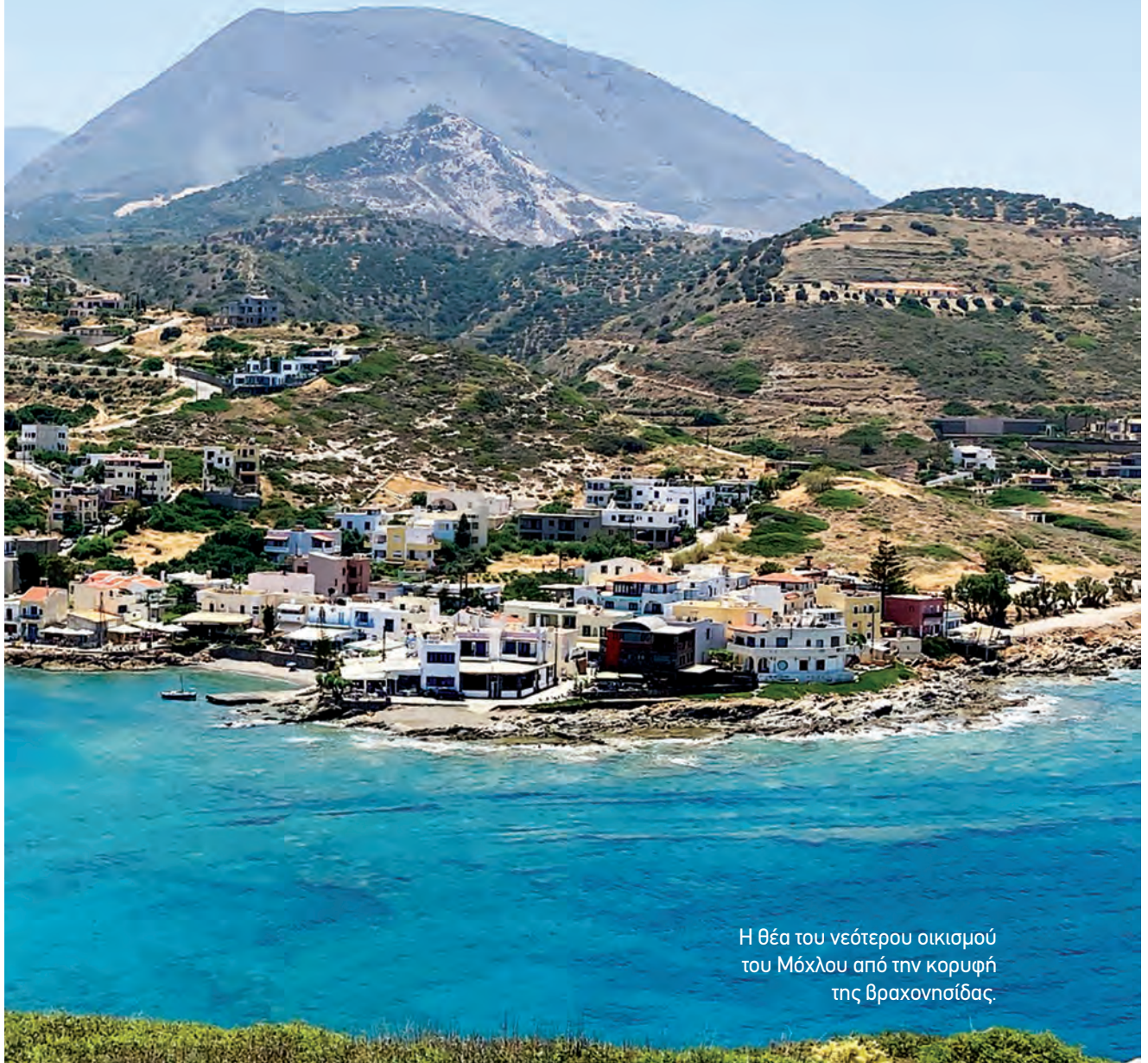
Η θέα του νεότερου οικισμού του Μόχλου από την κορυφή της Βραχονησίδας.