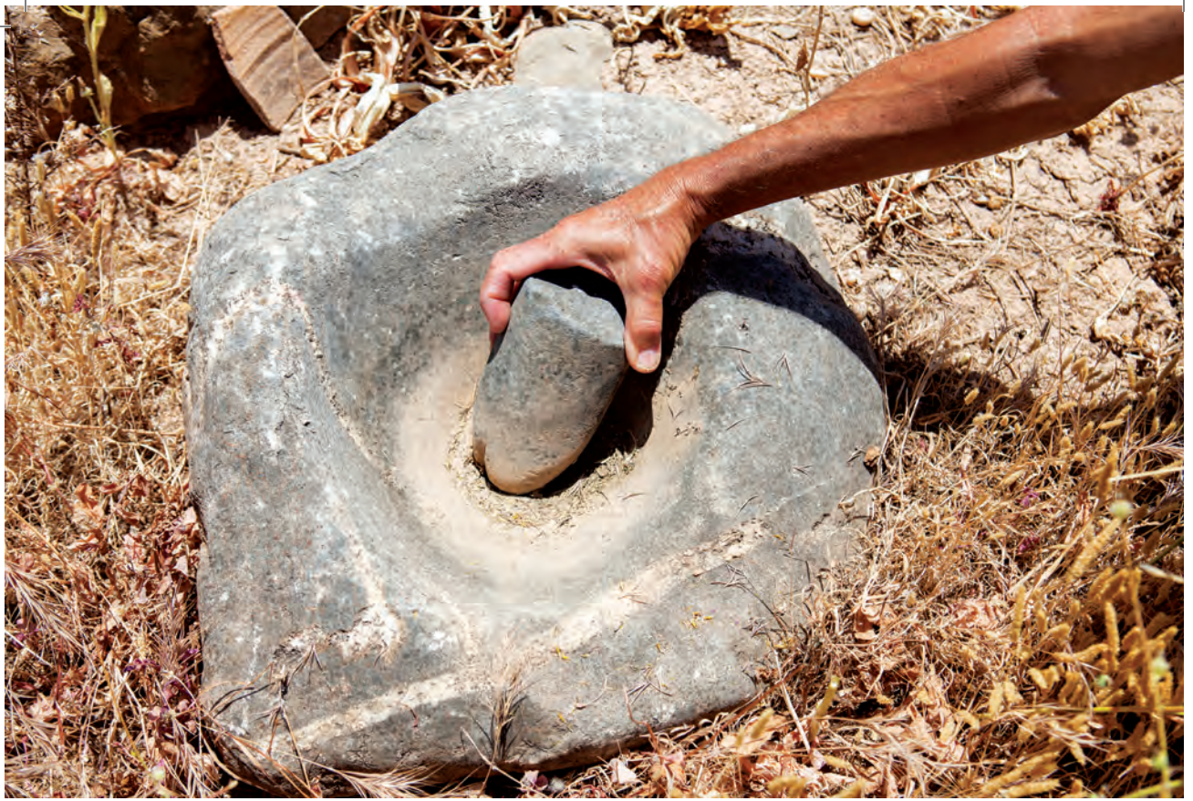
Αρχαίο γουδί με το γουδοχέρι του.

ένας πύργος στην κορυφή του νησιού. Τα πέτρινα μονοπάτια που οδηγούν περιμετρικά του οικισμού είναι από τα ωραιότερα διατηρημένα στην Κρήτη. Στα ερείπια μιας οικίας βρίσκουμε ένα πέτρινο γουδί μαζί με το λίθινο γουδοχέρι του. Παίρνουμε το ανηφορικό και λίγο επικίνδυνο μονοπάτι που οδηγεί στο νεκροταφείο. Τέτοια θέση για νεκροταφείο δεν έχω ξαναδεί πουθενά αλλού. Το νεκροταφείο του Μόχλου ανήκει στην Προανακτορική περίοδο και αποτελείται από τριάντα ορθογώνιους τάφους, χωρισμένους σε πολλά διαμερίσματα. Οι τάφοι ήταν οικογενειακοί και χρησιμοποιήθηκαν από το 3000 μέχρι το 1900 περίπου. Κοντά στους τάφους βρέθηκαν και πολλοί βωμοί που χρησιμοποιήθηκαν για τελετουργικές προσφορές σε προγόνους. Την περιήγησή μας διακόπτει αναπάντεχα μια απότομη μπόρα και είμαστε αναγκα-