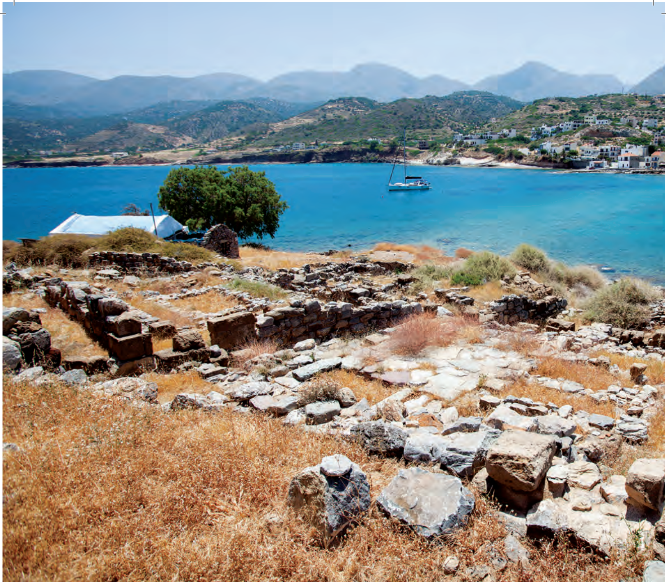
Τα ερείπια του μινωικού οικισμού στο νησάκι του Μόχλου.

πανέμορφου αυτού τόπου; Περπατούμε εντυπωσιασμένοι ανάμεσα στα στεναδάκια, με τα σπίτια και τις αυλές, όλα πεντακάθαρα, τα ρείθρα, τα κράσπεδα και τις ρούγες παστρικές και φρεσκοασβεστωμένες. Παντού μαγαζάκια και μικροί ξενώνες, δωμάτια ενοικιαζόμενα, ταβερνούλες, ψαρομάγαζα και ρακάδικα που συνιστούν μια ήπια πινελιά εμπορικών δραστηριοτήτων που δεν ενοχλεί ούτε προσβάλλει τον χώρο και τους επισκέπτες. Καθόμαστε σε ένα τέτοιο μαγαζάκι απέναντι από τη βραχονησίδα του Άη-Νικόλα, έτσι ώστε να έχουμε μπροστά μας τη