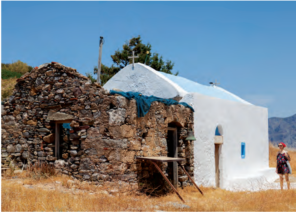
Το εκκλησάκι του Αη-Νικόλα. / Διαβαίνοντας την αρχαία πόλη.