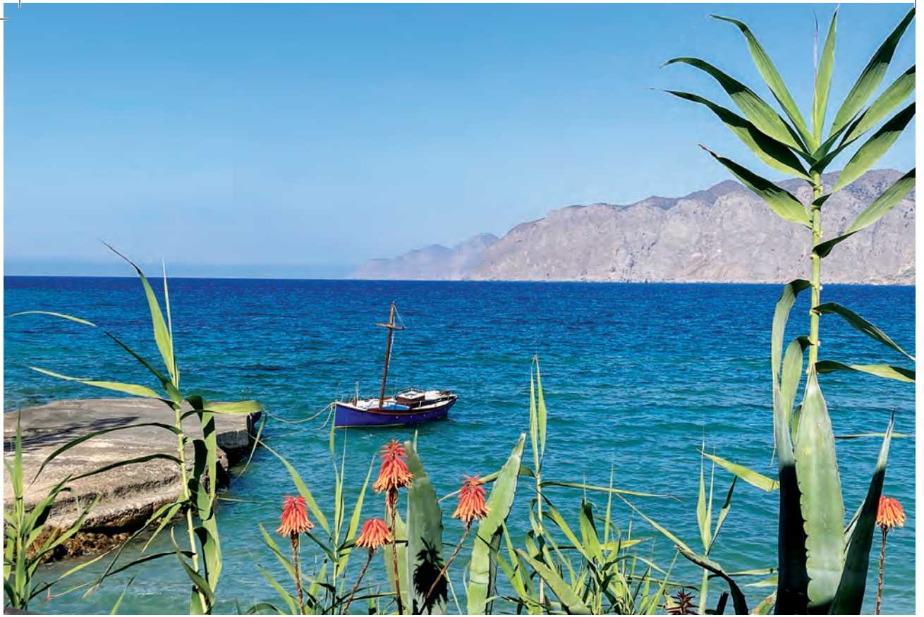
Το λιμανάκι του Μόχλου. / Γραφικό σπιτάκι από το εσωτερικό του οικισμού.