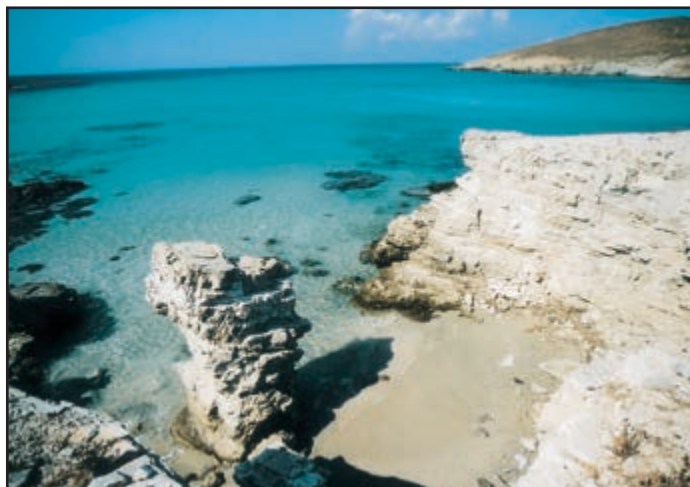
Μεγάλη Δήλος: Βράχια του φωτός κι εμφάνεια του πελάγου, να τα “γλωσσικά” στοιχεία στις ακρογιαλές του Ομήρου.

Στοιβαγμένοι άνθρωποι μες σε κιβώτια, σακκούλες κι εφόδια, πρυμάτσες υγρές, μπετζίνα χυμένη, νωπή - κι ένας γλυκός-γλυκός λεβάντες, γυριστός πέρα απ' τον κάβο τ' Αη - Γιώρ-