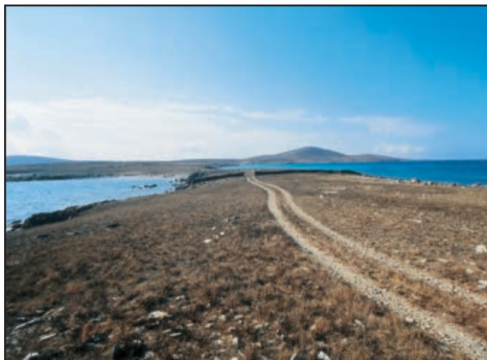
Τρακτερόδρομοι τέμνουν το χαμηλό πεδίο του νησιού και φτάνουν ως την άλλη άκρη.

Πριν φτάσω στην ακτή, τριγυρνώ τα χωράφια, τα καλύβια και