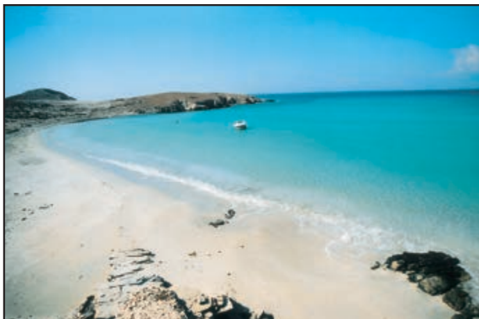
Απίστευτα γλαυκές ακρογιαλιές παντού στο αειφόρο σώμα της Ρήνειας

Μπουκάρει το τσούρμμο, σακιάζεται, αποπλέει το τρεχαντήρι του Συνεταιρισμού.