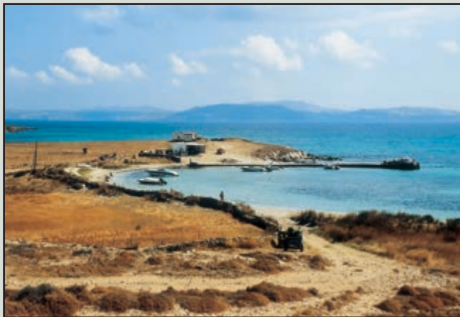
Κάσσαρης: Το αγκυροβόλιο της Ρήνειας. Στο βάθος η ανθρωποβόρα Μύκονος.

καμωμένο από ευγενή στοιχεία, από άδολους ανθρώπους, ζώα άφοβα, πλαγιές ολόγλυκες, μια θάλασσα διαμάντι, αλλά και μια σιωπή παντοδύναμη και πολύγλωσση.