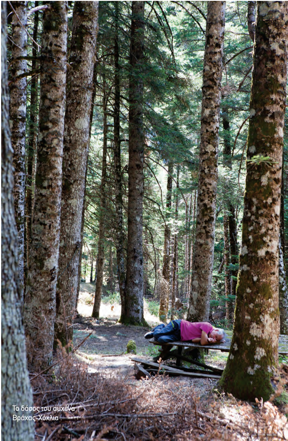
Το δάσος του αυχένα Βράχας-Χόχλια .