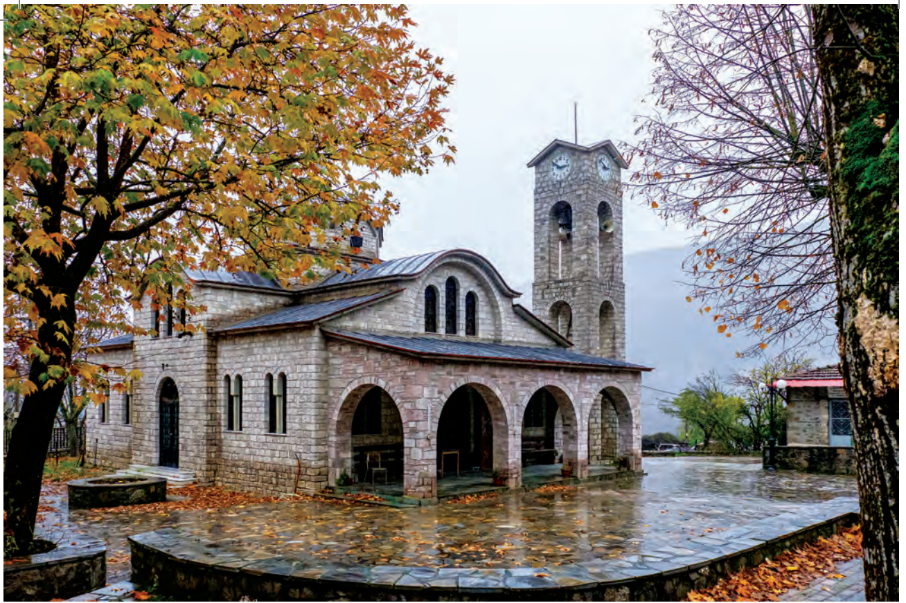
Ναός Αγίων Ταξιαρχών στο Μεσοχώρι.

φου αν επιχειρήσουμε ν' ανεβούμε ως την κορυφή της Τσιούκας –εύκολη υπόθεση μας είπαν – και σαρώσουμε με το βλέμμα ένα αδυσώπητο χάος που απλώνεται κάτω από τα βράχια της φοβερής ορθοπλαγιάς. Εκεί βασίλευε ο Κύφος στα τρωικά χρόνια. Αλλά πού βρήκε τη θάλασσα εδώ πάνω αυτός ο Κύφος και πολύ περισσότερο 22 καράβια, που λέει ο Όμηρος , για να εκστρατεύσει στην Τροία , μονάχα στο μυαλό ενός μεγάλου ποιητή μπορούμε να βρούμε. Μετά την επίσκεψη στον ναό του Αγίου Νικόλαου και προσκύνημα στο σκευοφυλάκειο, ήρθε η ώρα να αποδείξουμε τις αντοχές με το εργαλείο της ψυχής και των ποδιών.