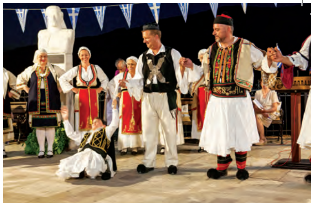
Γνήσιοι φουσανελάδες στις εκδηλώσεις για τους αγωνιστές του '21.

Τρία Σύνορα (1384 μ.) , θα διανύσουμε 2,8 χιλιόμετρα. Εδώ πρέπει να πούμε ότι υπάρχει και περιφερειακός δρόμος που παρακάμπτει το χωριό και συναντάει τον παλιό οδικό άξονα για τη Βράχα, λίγο πάνω από την κοιλάδα του ποταμού που στα ψηλώματα ονομάζεται Φουρνιώτης και στην απόληξή του αποκαλείται Μέγα Ρέμα . Επίσης πρέπει να πούμε ότι η κοιλάδα του Φουρνιώτη σχηματίζεται από τους μεγάλους παραπόταμους Αφωρεσμένο που πηγάζει από την Βουλγάρα, το ρέμα του Γιαπούλου που έχει τις πηγές του στα Τρίκορφα . Ένα τρίτο σημαντικό ρέμα – τροφοδότης του Μέγα Ρέματος είναι το ρέμα της Βουλγάρας που έχει τις πηγές του στην Κλεφτόβρυση . Σε μια από τις τελευταίες στροφές που επιχειρεί το ρέμα αυτό, εντελώς κρυμμένο και αθέατο βρίσκεται το πανέμορφο τοξωτό γεφύρι που κάποτε ένωνε τη Φουρνά με το Κλειτσό. Μέχρι την επόμενη διασταύρωση του δρόμου για Κλειτσό, η απόσταση από Φουρνά είναι 5,1 χιλιόμετρα.