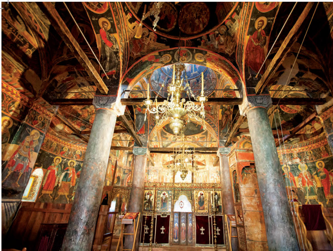
Ο κεντρικός ναός και το ξυλόγλυπτο τέμπλο του. Ο τρούλος με τον Παντοκράτορα (δεξιά).

24 η Εφορεία Αρχαιοτήτων Φθιώτιδος και Ευρυτανίας.