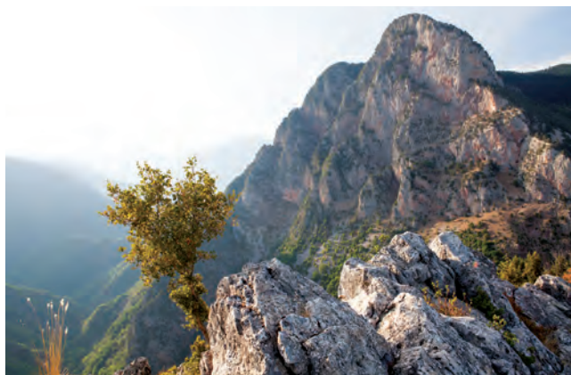
Βαδίζοντας στο δρυοδάσος της Μονής για το Καστρί.