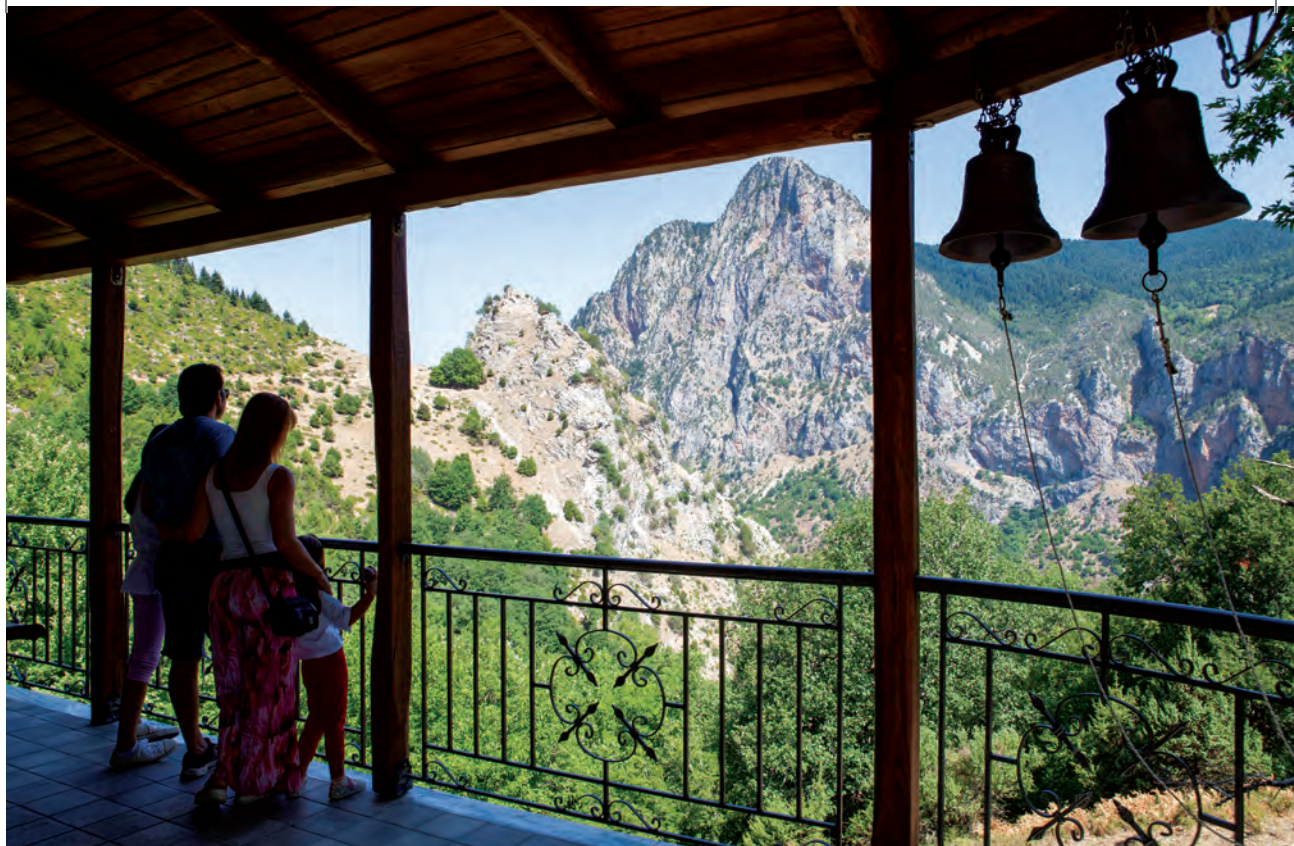
Η άποψη της Τσιούκας από τον εξώστη της Μονής Βράχας. Γεφύρι στον παραπόταμο του Φουρνιώτη που ένωνε Κλεισό-Φουρνά.