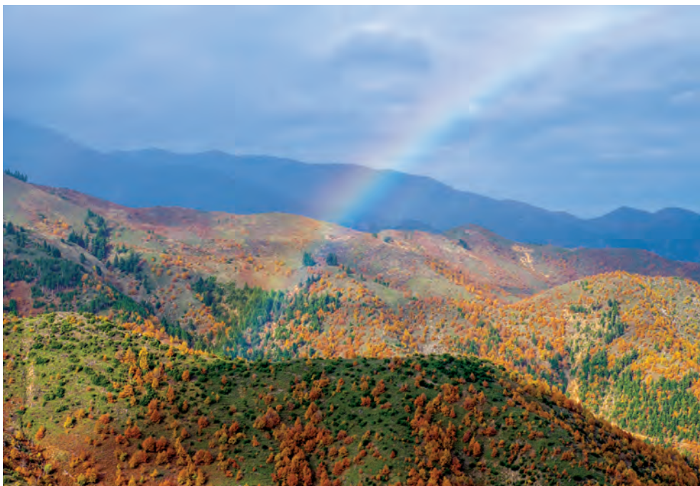
Φθινοπωρινά χρώματα στην διαδρομή για τη Φουρνά.

Εκεί σταματήσαμε, καθώς βρεθήκαμε μπροστά σε ένα φαρδύ τετράσταυρο που οδηγούσε, ο δεξιός πόλος στον Κλειτσό (ή Κλειστό), ο μεσαίος στη Βρύση Ζαχαράκη και ο αριστερός στον Μαυρόλογγο (οικισμός του Κλειτσού).