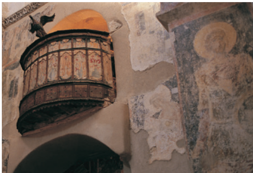
Μητρόπολη, Αγ. Δημήτριος. Εσωτερικό.