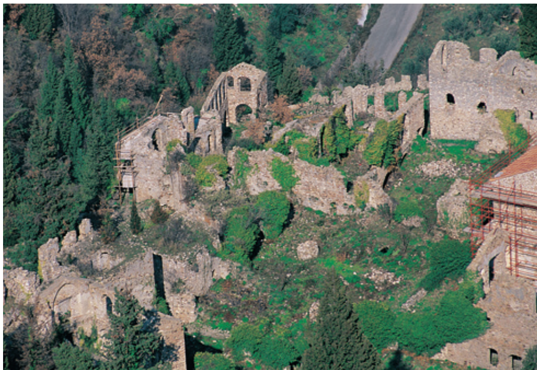
Η πύλη τ' Αναπλιού. Μια από τις δύο οχυρωμένες πύλες από την οποία γίνονταν η είσοδος στην περιτειχισμένη «χώρα».

βουνά και στους γκρεμούς χτισμένα τειχιά νεροφαγωμένα που στέκονται βουβά και αμίλητα. Η γη μας η γερασμένη πατήθηκε από λογής λογής έθνη. Απάνου στα πρώτα, στα πιο αρχαία θεμέλια, χτίσανε οι κατοπινοί, ντόπιοι και ξένοι, οι Βυζαντινοί, οι Καταλάνοι, οι Τούρκοι. Κάθεσαι σ' ένα μπεντένι και ρίχνεις τη ματιά σου με τρομάρα μέσα στην άβυσσο που γκρεμνίζεται κατακέφαλα ως τις ρίζες του βουνού. Πέρα μακριά σβήνουνε στεριές και θάλασσες. Χωριά, πολιτείες, χωράφια, αμπέλια απλώνονται από κάτω, μα δεν ακούγεται τίποτα, σαν νάναι πεθαιμένα. Στα χαλάσματα βρίσκονται ακόμα χελώνες και φίδια, μ' αυτά είναι πλάσματα βουβά και δεν ακούγονται. Αλλά και τα πουλιά είναι λιγοστά και εκείνα μακριά. Από τα μεγάλα απομείνανε τα όρνια, οι αγιούπες που φωλιάζουνε στις τρύπες των γκρεμών και πετάνε βαριά σαν κοιμισμένα χωρίς να βγάλουνε κραξιά, κόβοντας βόλτες απάνω από το μέρος. Οι αετοί φανερώνονται ανάγια, μα δε φωνάζουνε ποτέ και πετάνε πολύ ψηλά. Κάστρα υπήρχανε πολλά στις Ελλάδας και της Ανατολής τα μέρη. Ο Μοριάς είχε στα φράγκικα χρόνια απάνου