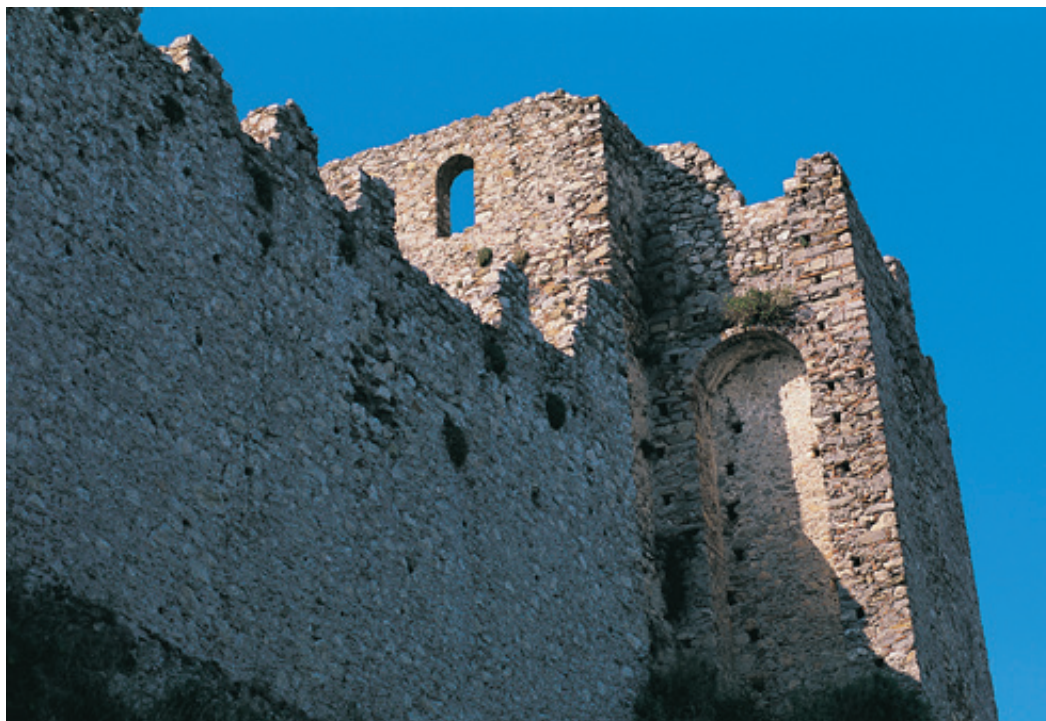
Θλιβερά απομεινάρια της πρόσκαιρης ανθρώπινης δόξας και δύναμης στέκουν πια τα τείχη του κάστρου.