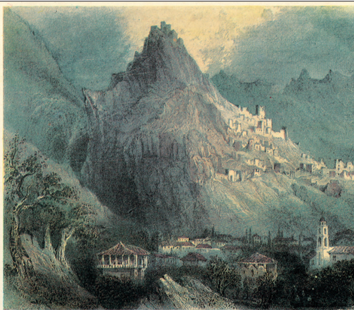
Mistra, near Sparta, Greece.