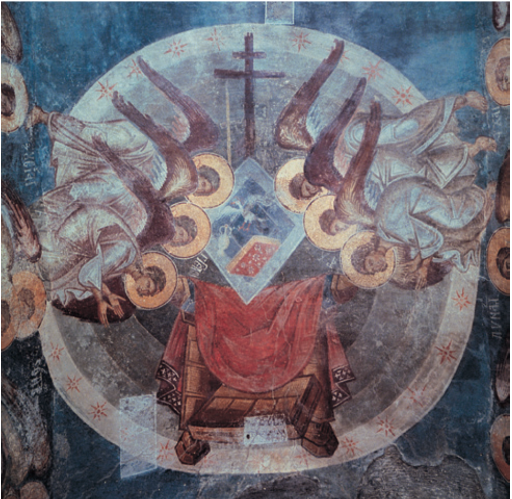
ΦΩΤ. ΟΙΚΟΣ ΓΕΩΡΓΙΑΔΗ-ΣΠΑΡΤΗ

Ειρήνη. Φωνή που επαναλήφθηκε τρεις φορές από το αρχοντολόι και τρεις από το λαό. Οι άρχοντες γιόρταζαν, οι ιερείς το ίδιο, το ίδιο και ο λαός. Εκείνος όμως, ο εστεμμένος Αυτοκράτωρ, ο Κωνσταντίνος ο Παλαιολόγος ζούσε κι εκείνος τη μεγάλη στιγμή της στέψης. Τη ζούσε όμως όχι όπως οι άλλοι. Δεν έβλεπε γιορτάσι, δεν έβλεπε χαρά. Δεν ένοιωθε τα στήθη του να φουσκώνουν από περηφάνια, που τώρα γινόταν ο πρώτος της Αυτοκρατορίας. Το στέμια τ' ένοιωθε βαρύ. Ο πορφύρεος χιτώνας έμοιαζε σαν κάτι αφόρητο. Το φόρεσε και άκουσε τις ευχές του λαού, είδε μάτια δακρυσμένα γύρω του και το στήθος του φούσκωσε από ένα δύσκολο κρυμμένο στεναγμό. Όλοι, αρχοντολόι και λαός, περίμεναν τα πάντα από εκείνον. Περίμεναν τα θαύματα, περίμεναν ένα ξαναζωντανέμα.