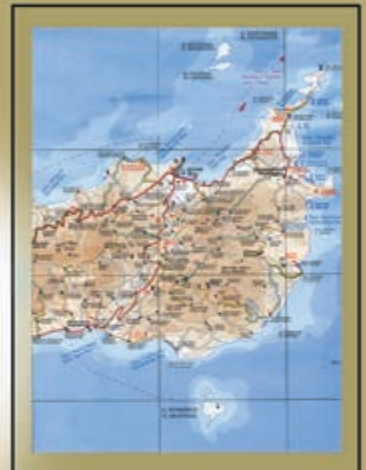
Χάρτης του Κουφονησίου του Δήμου Λεύκης. Και δίπλα τμήμα της ανατολικής Κρήτης από τον χάρτη "Κρήτη" των Road Editions