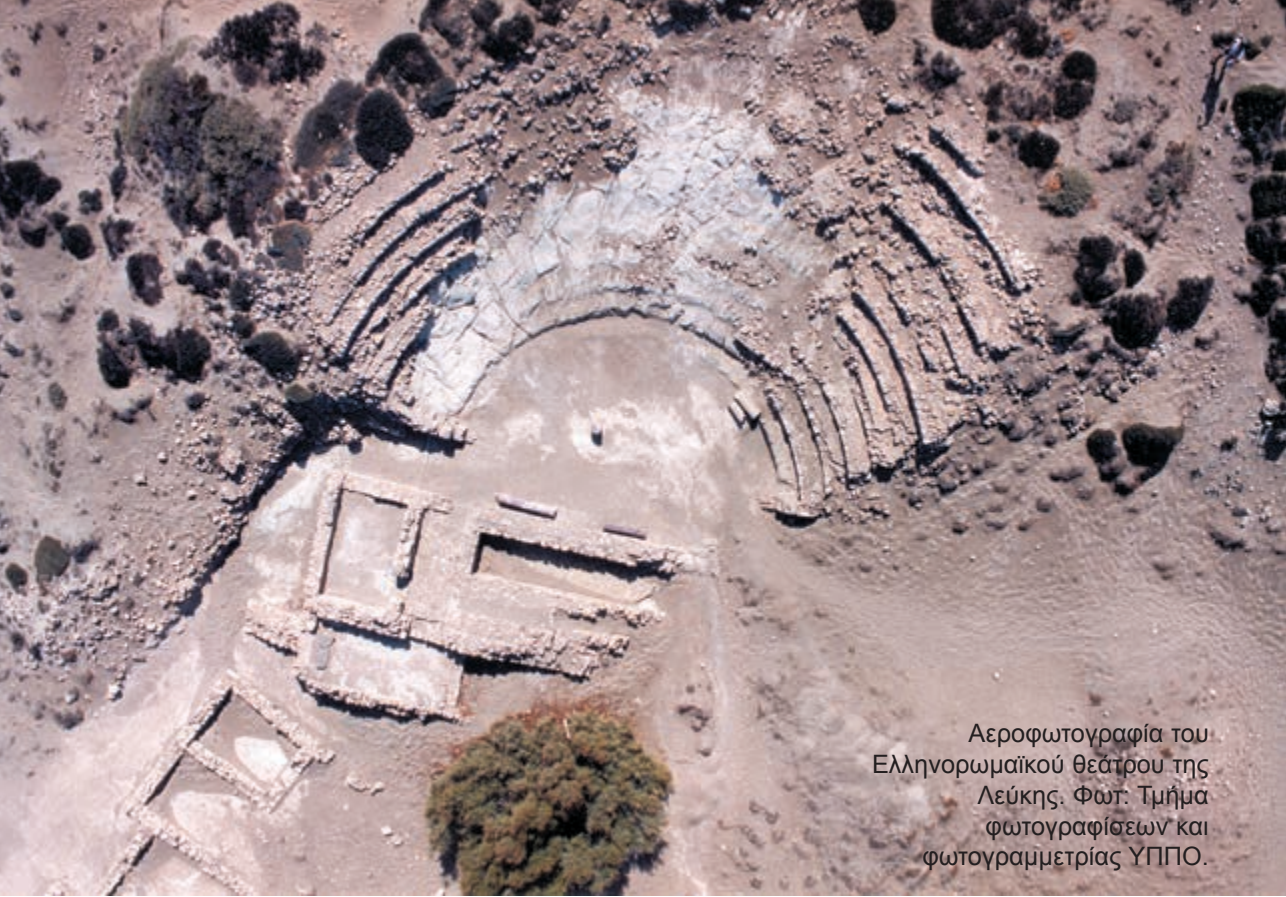
Αεροφωτογραφία του Ελληνορωμαϊκού θεάτρου της Λεύκης.