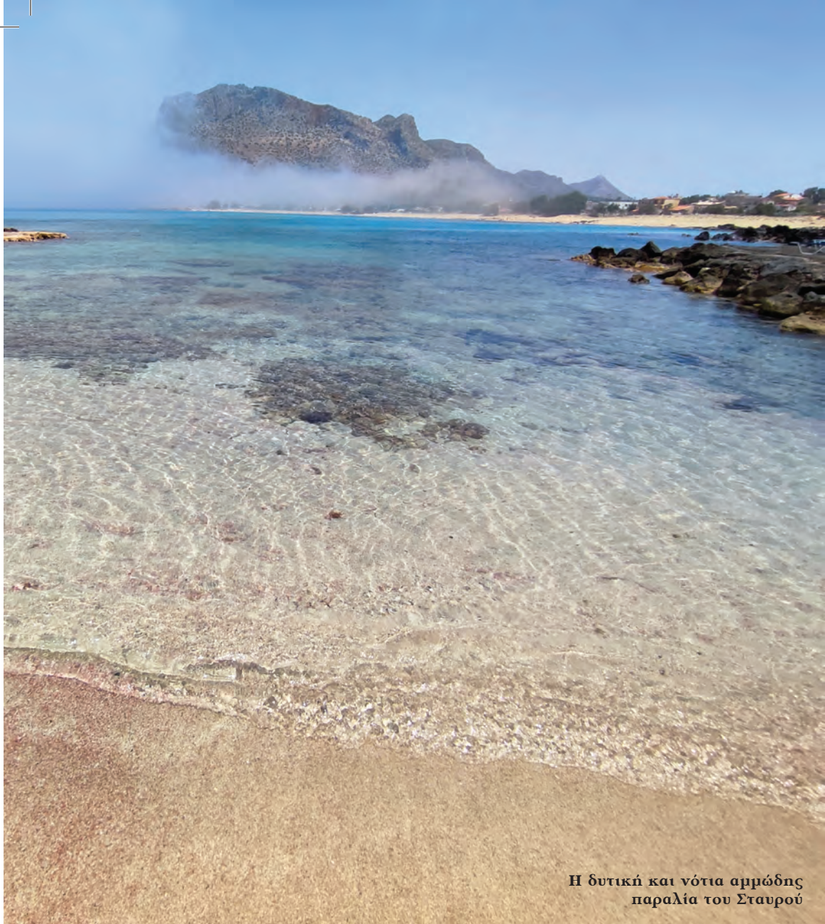
Η δυτική και νότια αρμόδης παραλία του Σταυρού

Ακρωτηρίου, όπου σμίγει ο λευκός πέτρινος όγκος των Βάρδιων με τον πολυχρωματικό βυθό, στο μεταίχμιο στεριάς και θάλασσας, ο Μιχάλης Κακογιάννης τοποθέτησε τη σκηνή του χορού με την αθάνατη μουσική υπόκρουση του Θεοδωράκη. Ο λογοτεχνικός ήρωας του Καζαντζάκη έχει όλα τα αρχέγονα αλλά και σημερινά προτερήματα και ελαττώματα του Έλληνα. Τυχοδιώκτης Οδυσσέας, έξυπνος, φιλότιμος,