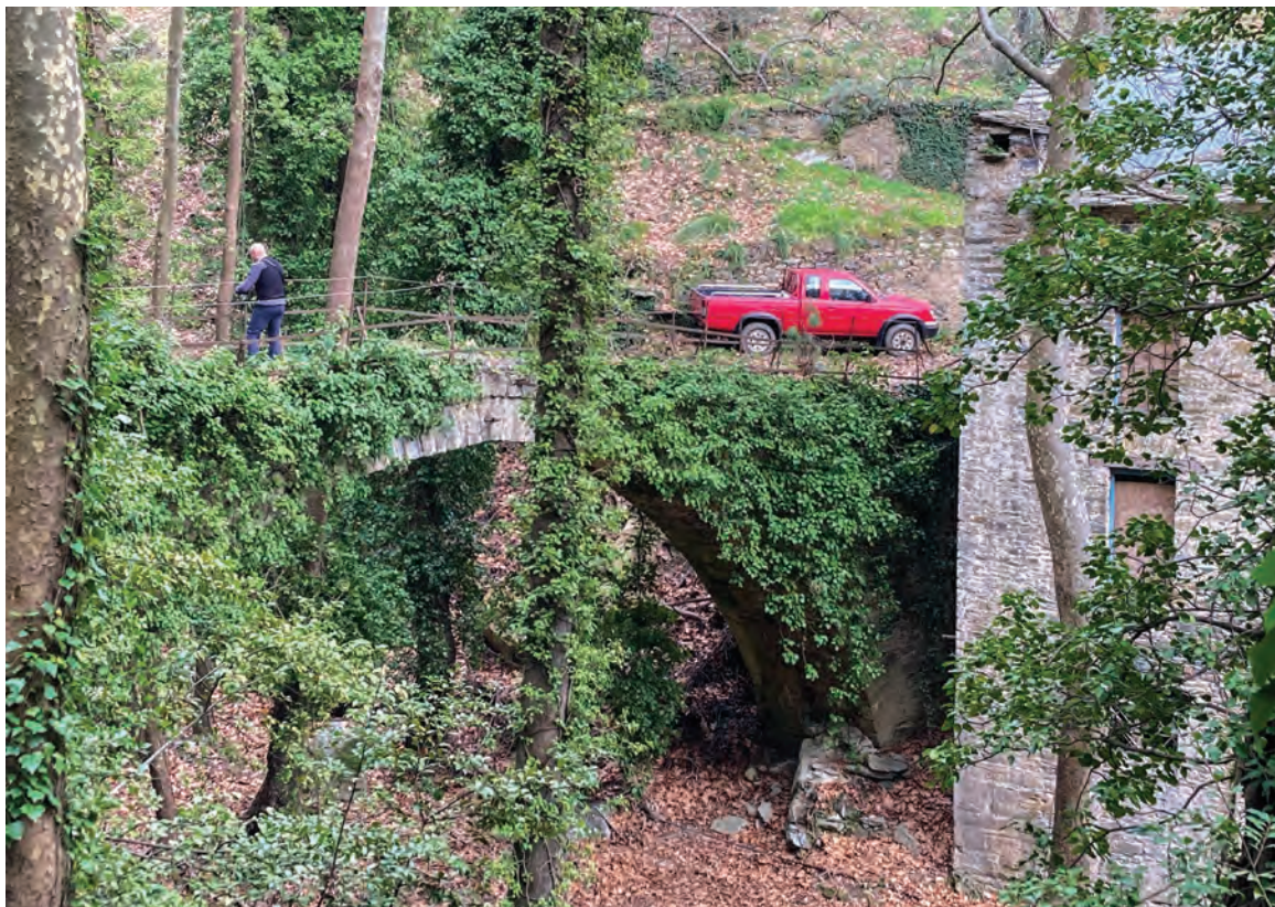
Το πέτρινο γεφύρι του Μίχου που είναι “δεμένο” πάνω στο μύλο Η εξωτερική άποψη του μύλου, με το δώμα του

την εποχή μηχανήματα. Η λειτουργία τού σπάνιου αυτού λιοτριβιού και αλευρόμυλου συνάμα σταμάτησε οριστικά το έτος 1973, αφού προσέφερε υπηρεσίες για ογδόντα χρόνια ανελλιπώς. Ενσωματωμένο στο διώροφο κτίσμα τού Μίχου είναι το ομώνυμο γεφύρι της ρεματιάς. Από καλντερίμι πια, που ανηφορίζει με δυναμική κλίση, βρισκόμαστε σε λίγο στα πρώτα σπίτια της Δράκειας. Διασχίζουμε τον ασφαλτόδρομο πάλι και περνάμε απέναντι, για να πιάσουμε το καλντερίμι που συναντά ανηφορίζοντας αριστερά τη φιγούρα άλλου παλιού και μισογκρεμισμένου νερόμυλου. Βγαίνουμε στα πρώτα αρχοντικά του χωριού και μέσα απ' την κεντρική του ρούγα φτάνουμε στην επάνω πλατεία, την ομορφότερη και πιο θεαματική