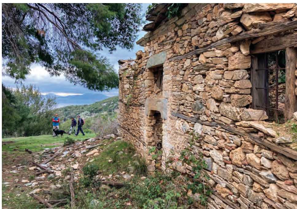
Έξω από το μοναστηράκι του Άη-Δημήτρη

γοργόστροφοι, χύνονται θυμωμένα με γύρες και σιφόνια, ψυχάζοντας μόνο σε επιτόπιες βάθρες. Ένα πολύμορφο τέρας, δρακόσχημο κι οφιοειδές, που συναντά θεριούς βράχους και τους υπερπηδά αφρίζοντας. Προχωρούμε κατά μήκος της άκριας του χωριού, ανάμεσα από καρυδιές κι οπωροφόρα, έως να φτάσουμε στο εξωκλήσι του Αϊ-Σπυρίδωνα. Το παλιό ξύλινο γεφυράκι με την τριγωνική δεσιά, η μαντρωμένη βρύση, το τελευταίο αρχοντικό, το πεντάμορφο ξωκλήσι, απέξω η περίτεχνη, πέτρινη κρήνη, το θεόρατο πολύκλαδο κυπαρίσσι, η καμπάνα αψηλά στη φλαμουριά δεμένη, τη φλαμουριά που οι ντόπιοι λένε τίλιο, το λουλουδισμένο μπλοπερίβολο από κάτω, με τ' αρνάκια να βόσκουν αμέριμνα το φρέσκο χορτάρι. Η ωραία αυλή, η νέα τζαμένια προθήκη, η παλιά σόμπα κι απάνω της το ξεχασμένο θυμιατό, οι τρεις αγιογραφίες στους τοίχους, ο άγιος Ευστάθιος καθάλα στο λευκό του άτι «κυνηγάει την έλαφον» τεντώνοντας το δοξάρι· μια ωραία ανώνυμη εποποιία κυνηγιού καμωμένη το 1900, λίγο