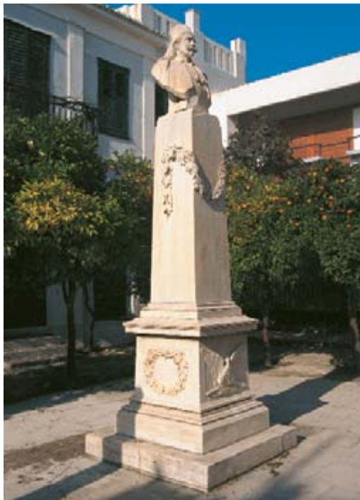
ΦΩΤ. Γ. ΦΑΦΟΥΤΗΣ

στις 12 Ιουλίου του 1470 και ολόκληρη η Εύβοια υποτάσσεται στους Τούρκους. Ακολουθεί μια περίοδος σκοτεινή, που οι πληροφορίες είναι ελάχιστες. Μετά από συστηματική έρευνα σε διάφορες περιοχές ο Μπελλάρας καταλήγει στο συμπέρασμα, ότι οι οικητορες του Ελύμνιου μετά το 1470 προέρχονται κυρίως από τη Σάμο, το Κουσάντασι (Νέα Έφευσο) και τα Σώγια, στην ενδοχώρα του Κουσάντασι. Και από το Ελύμνιον όμως υπάρχει μετανάστευση. Έτσι στα 1790, 50 περίπου οικογένειες εγκαταλείπουν τη γενέτειρά τους και εγκαθίστανται στη γειτονική