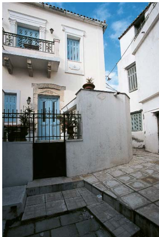
Χαρακτηριστικά σφυρήλατα κάγκελα και διακοσμητικά μαρμαρίνα φουρούσια σε μπαλκόνι νεοκλασικού αρχοντικού στην Λίμνη. (Επάνω Αριστερά) Σπίτι του 1873 σε ένα από τα γραφικά στενά του οικισμού της Λίμνης. (Επάνω Δεξιά)