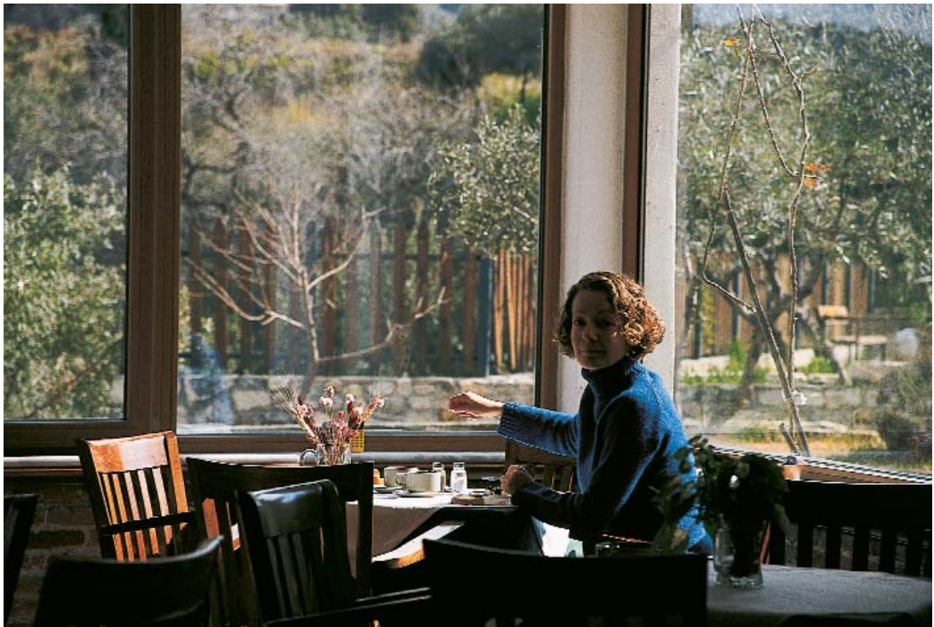
Πρωινό στη Βατερή, μέσα στο εξάισιο φυσικό περιβάλλον του ελαιώνα.

ιδιαίτερα ευχάριστη, είτε στη μεγάλη αίθουσα είτε στο δωμάτιο. Εξ' άλλου παρά την ηλιοφάνεια τόσων ημερών, τα χιόνια εξακολουθούν να απριζούν στις κορυφές του Ξηρού όρους και του Καβαλάρη. Έτσι όπως τις αντικρίζουμε από μακρυνά χιονόλευκες μας γεννιέται η επιθυμία για μια δεύτερη επίσκεψη κοντά τους. Ξαναπαίρνουμε λοιπόν τον δρόμο για μια μεγάλη περιοδεία στα ορεινά, ξεκινώντας τη φορά αυτή από τη Βατερή και ακολουθώντας την κατεύθυνση προς τη Χαλκίδα. Μετά από λίγη ώρα είναι αδύνατον να πιστέψουμε στα μάτια μας. Όλη η ορεινή ζώνη, από υψόμετρο 400 μέτρων και πάνω, είναι ολοκληρωτικά καλυμμένη με παχύ στρώμα χιονιού,