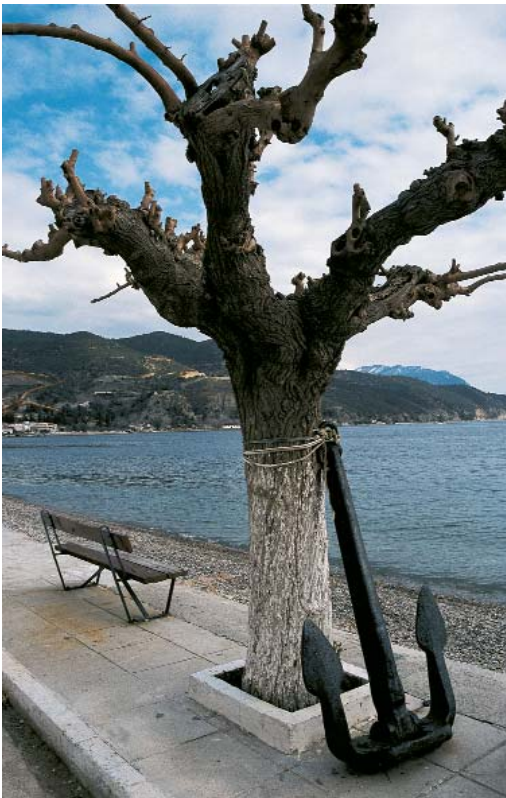
Η μεγάλη άγκυρα του παλιού ιστιοφόρου στην προκουμαία θυμίζει την ναυτική παράδοση της Λίμνης. (Επάνω) Γραφική αφίδα στο δυτικό τμήμα της προκουμαίας της Λίμνης.

Από το 1888 όμως αρχίζει να επικρατεί μια γενική θαλάσσια κρίση, που υποχρεώνει τα ιστιοφόρα, το ένα μετά το άλλο να δένουν στα λιμάνια και να παροπλίζονται ή να πωλούνται σε εξευτελιστικές τιμές. Η κυριαρχία της ατιμήλατης ναυτιλίας είναι πλέον καθολική. Οι Λιμνιώτες προσπαθούν ν' ανταποκριθούν στις απαιτήσεις των καιρών αρκετοί μάλιστα απ' αυτούς αποκτούν σημαντικά ατμόπλοια στις αρχές του 20ου αιώνα. Ήδη όμως η αντίστροφη μέτρηση έχει αρχίσει, η Λίμνη ποτέ δεν θα μπορέσει να προσαρμοστεί στα νέα δεδομένα με την επιτυχία που το έκαναν άλλες ναυτικές πόλεις, όπως τα Καρδάμυλα και η Άνδρος. Στο σημείο αυτό ο Μπελλάρας είναι κατηγορηματικός: "Εις άλλους ναυτικούς τόπους, ως