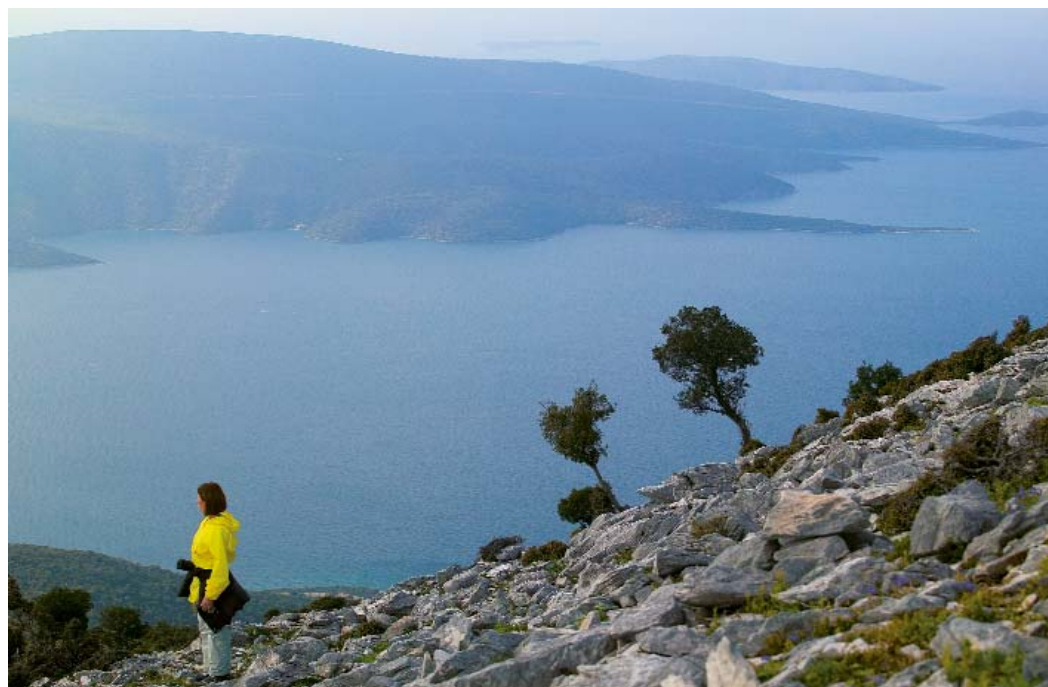
Το πανόραμα των ακτών του Παγασητικού από τα ύψη του Τισσαίου.