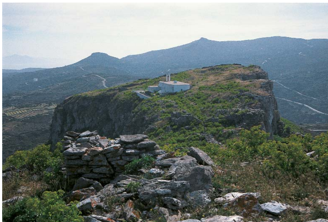
Η κατάληξη του Παλαιόκαστρου με το μικρό εκκλησάκι της Παναγίας. (Επάνω) Ερειπωμένη οριζόντιοι ανεμόμυλοι γνωστοί και ως ταβλόμυλοι μοναδικοί στις Κυκλάδες, στην περιοχή του Παλαιόκαστρου.