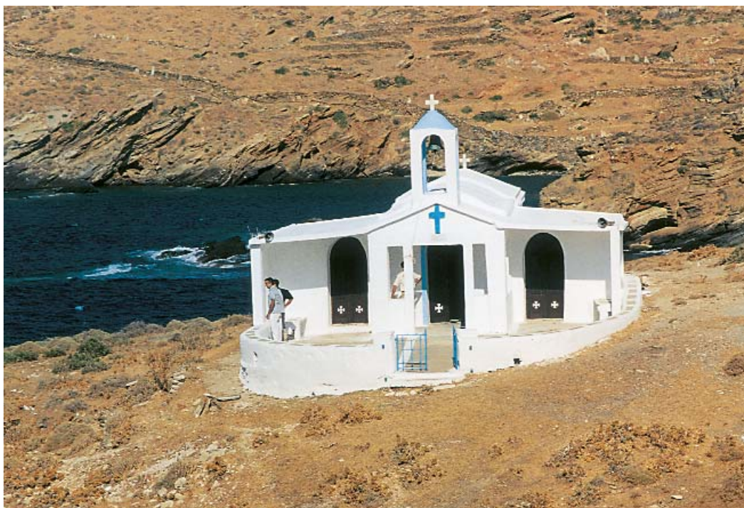
Στη Νότια άκρη του Όρμου, πάνω στα βράχια το ιδιωτικό εκκλησάκι του Αγίου Φανουρίου, γιορτάζει τον Αύγουστο με πανηγύρι.