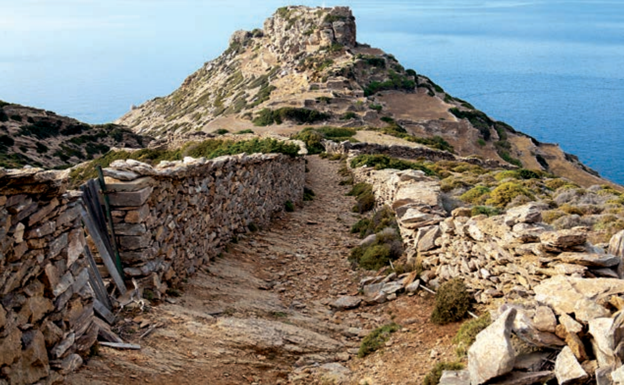
Η αρχαία δίοδος με την ακρόπολη της Αρκεσίνης στο Βάθος. (Επάνω) Κατηφορίζοντας για το κάστρο της Αρκεσίνης περνάμε τον Αϊ-Γιάννη. (αριστερά)

τη βασική ακρόπολη του Καστριού, καθώς και με τη χρησιμότητα ή το ρόλο που μπορεί να έπαιξε στην εποχή που κατασκευάστηκε. Η απόσταση δε του ενός από το άλλο αρχαίο μνημείο της Κάτω Μεριάς Αμοργού είναι αρκετά μεγάλη.