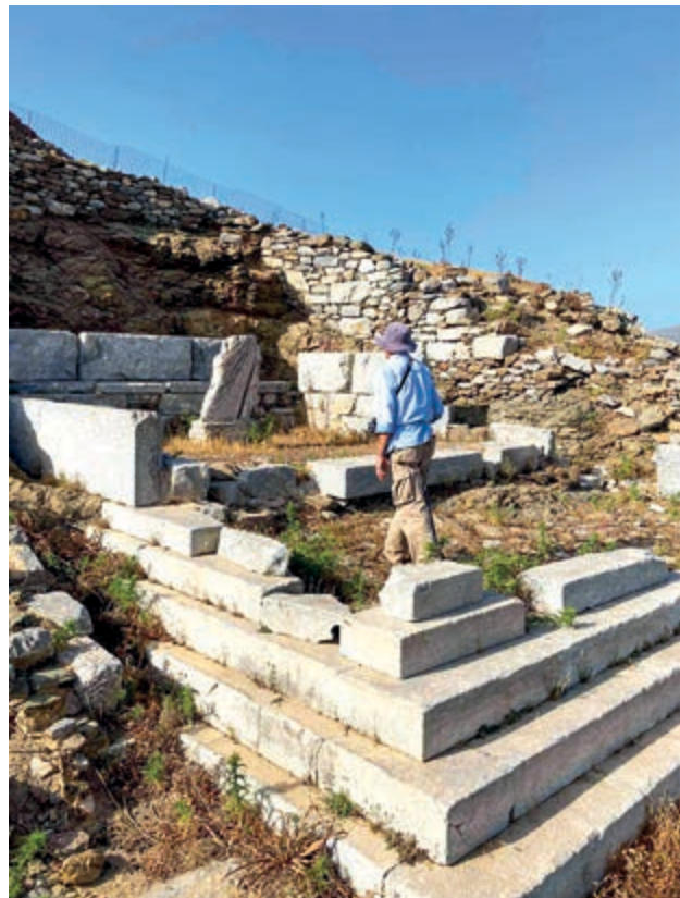
Στον αρχαιολογικό χώρο της Μινώας.

Διατρέχοντας το σώμα του νησιού από τη Χώρα και κάτω, θα κάνουμε ένα σύντομο πέρασμα από τη Μινώα και το μοναστηράκι του Αϊ-Γιώργη του Βαλααμίτη,