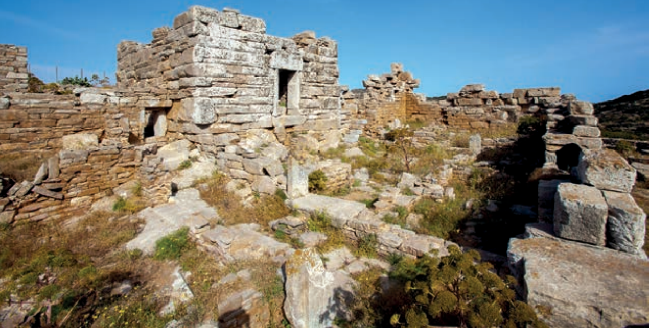
Τμήμα του πύργου της Αγ. Τριάδας (4ος π.Χ. αι.).

πτό βότσαλο), που την περιβάλλουν κάθετες ορθοπλαγιές και βαθυγάλαζα νερά με απότομους βυθούς.