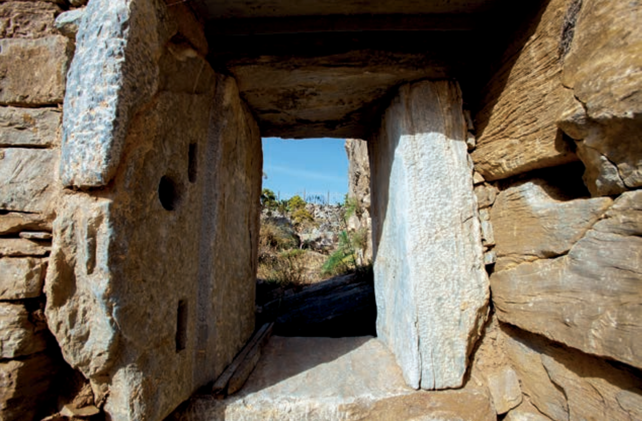
Άποψη από το εσωτερικό του πύργου. Αρχαία μύλόπετρα στο προαύλιο του πύργου.