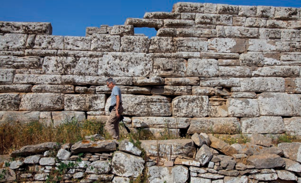
Η νοτιοανατολική πλευρά του πύργου. Εσωτερικό θύρωμα του πύργου.