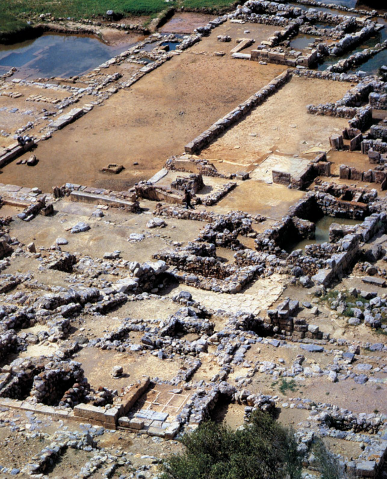
Αεροφωτογραφία του ανακτόρου και της πόλης της Ζάκρου (πηγή