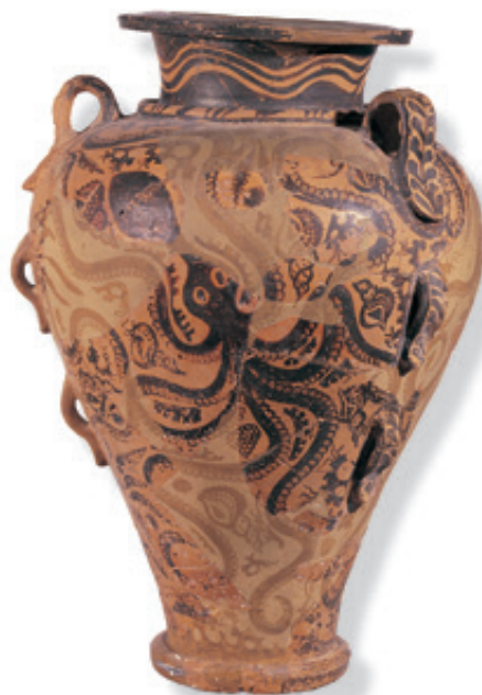
Αγγείο του “θαλασσίου ρυθμού” από το ανάκτορο.

Σε ποια θεότητα, όμως, μπορεί ν' απευθύνονταν τέτοιες προσφορές σ' ένα τέτοιο χώρο; Σίγουρα σε μία χθόνια θεότητα, μια θεότητα δηλαδή που είχε το βασιλείο της στα έγκατα της γης. Στις μεταγενέστερες ομηρικές διηγήσεις, (που όμως πρέπει να θυμόμαστε ότι έχουν ενσωματώσει πολλά στοιχεία που προέρχονται από προγενέστερες της εποχής του Ομήρου αντιλήψεις), η θεότητα αυτή ήταν ο Ποσειδώνας. Ο θεός των σεισμών! Να από τι παρακαλούσαν οι κάτοικοι της Ζάκρου να τους απαλλάξει μια χθόνια θεότητα! Η ελαφρόπετρα τότε; Σεισμοί και ελαφρόπετρα ένα μόνο κοινό αίτιο μπορεί να έχουν: μία ηφαιστειακή δράση! Τώρα εύκολα μπορεί κανείς να καταλάβει γιατί ο ανασκαφέας της Ζάκρου, από τα πρώτα κιόλας χρόνια της έρευνάς του στη θέση, είχε πεισθεί ότι η μεγάλη καταστροφή των μινωικών κέντρων οφειλόταν στη γνωστή στους γεωλόγους έκρηξη του ηφαιστείου της Θήρας. Πρόσθεσε ακόμα στα επιχειρήματά του, ότι πολλοί τοίχοι του ανα-