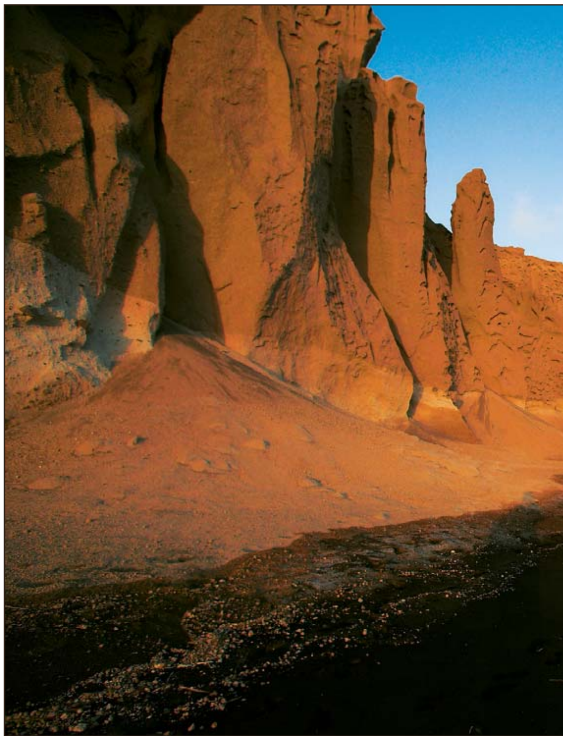
Ένα τείχος συνεχές πάνω από την ακτή της