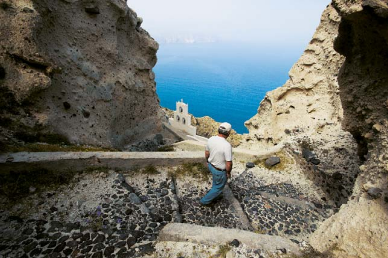
Τμήμα της συναρπαστικής διαδρομής με το ωραίο καλντερίμι προς την Παναγιά της Πλάκας. Τα σπιτάκια των παλιών ιαματικών λουτρών, που τα τελευταία χρόνια έπαψαν να λειτουργούν.