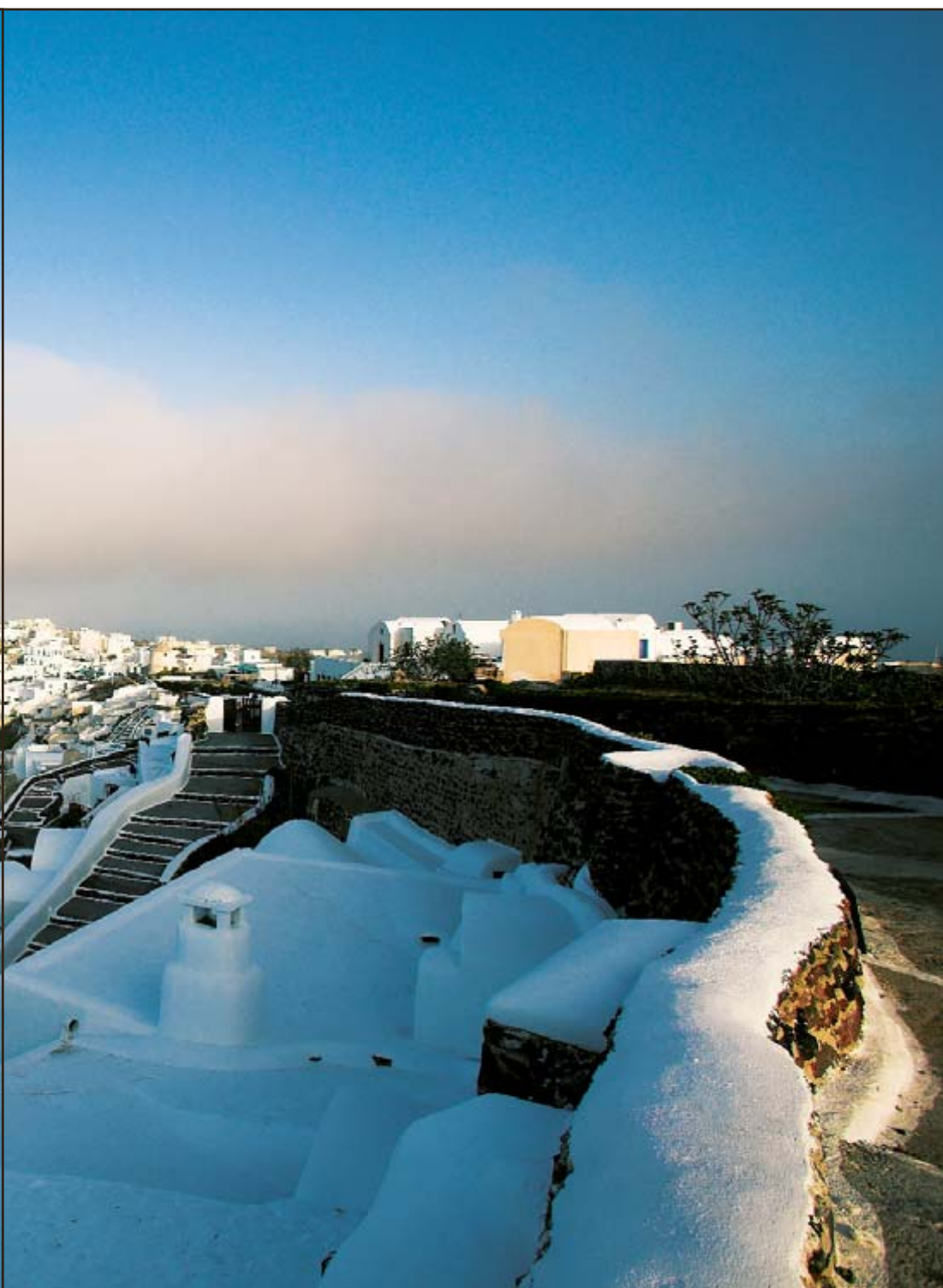
Καλντέρας, στη μαγευτική Οία, στα υπόλοιπα ηφαιστειογενή νησιά και