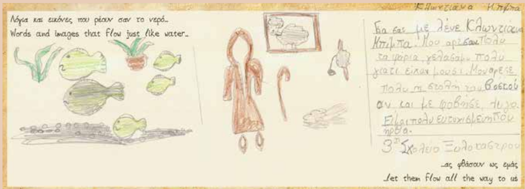
Ζωγραφιές μαθητών από το εκπαιδευτικό πρόγραμμα "Παιχνίδια μυστικά στις λίμνες τα νερά", που διεξήχθη στο πλαίσιο της δράσης "Περιβάλλον και πολιτισμός 2011 - φωνές νερού μυριάδες".

Το Π.Ι.Ο.Π. συνεργάζεται αποτελεσματικά με την Τοπική Αυτοδιοίκηση, το Υπουργείο Πολιτισμού και τις Περιφέρειες της χώρας για τη δημιουργία δικτύου θεματικών μουσείων. Με την αρωγή της Τράπεζας Πειραιώς αλλά και ευρωπαϊκές χρηματοδοτήσεις το Δίκτυο Μουσείων αναπτύσσεται διαρκώς και μεταφέρει στην ελληνική περιφέρεια πολιτιστικές δραστηριότητες υψηλών προδιαγραφών.