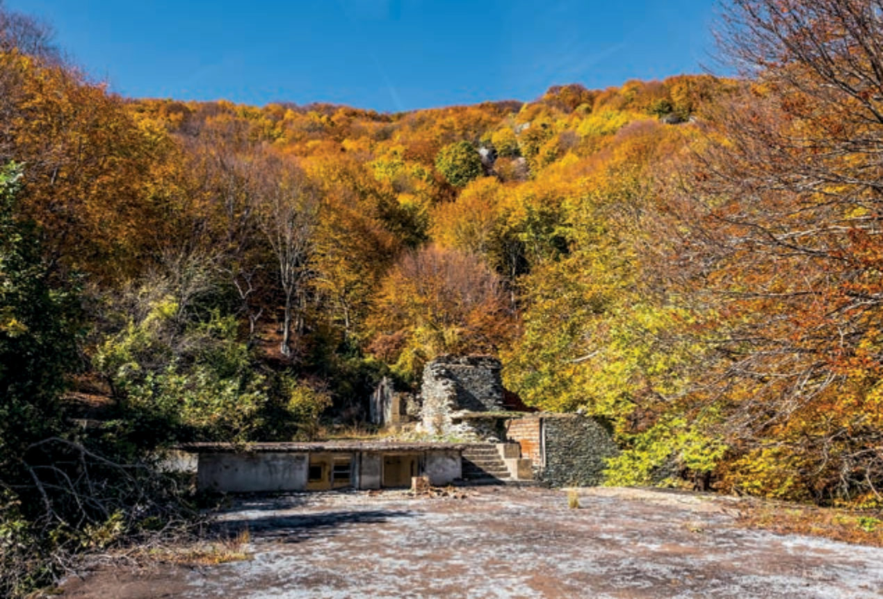
Τα ερείπια από το κτίριο των Χελιδονιών.