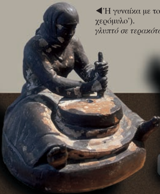
◀ ‘Η γυναίκα με το χερόμυλο’). γλυπτό σε τερακότα.