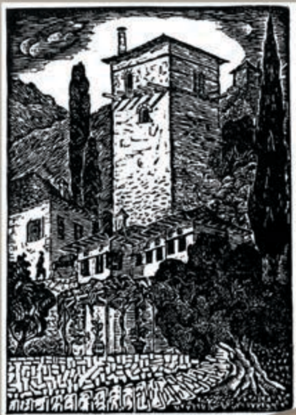
▲ Τουρκόπυργος στο Πήλιο. “ξύλογραφία”

Νοεμβρίου, κατά δε την χειμερινή περίοδο είναι ανοιχτό κατά τα Σαββατοκύριακα και τις μεγάλες γιορτές. Η είσοδος καθώς και η ξενάγηση από αρμόδια κοινοτική υπάλληλο είναι δωρεάν.