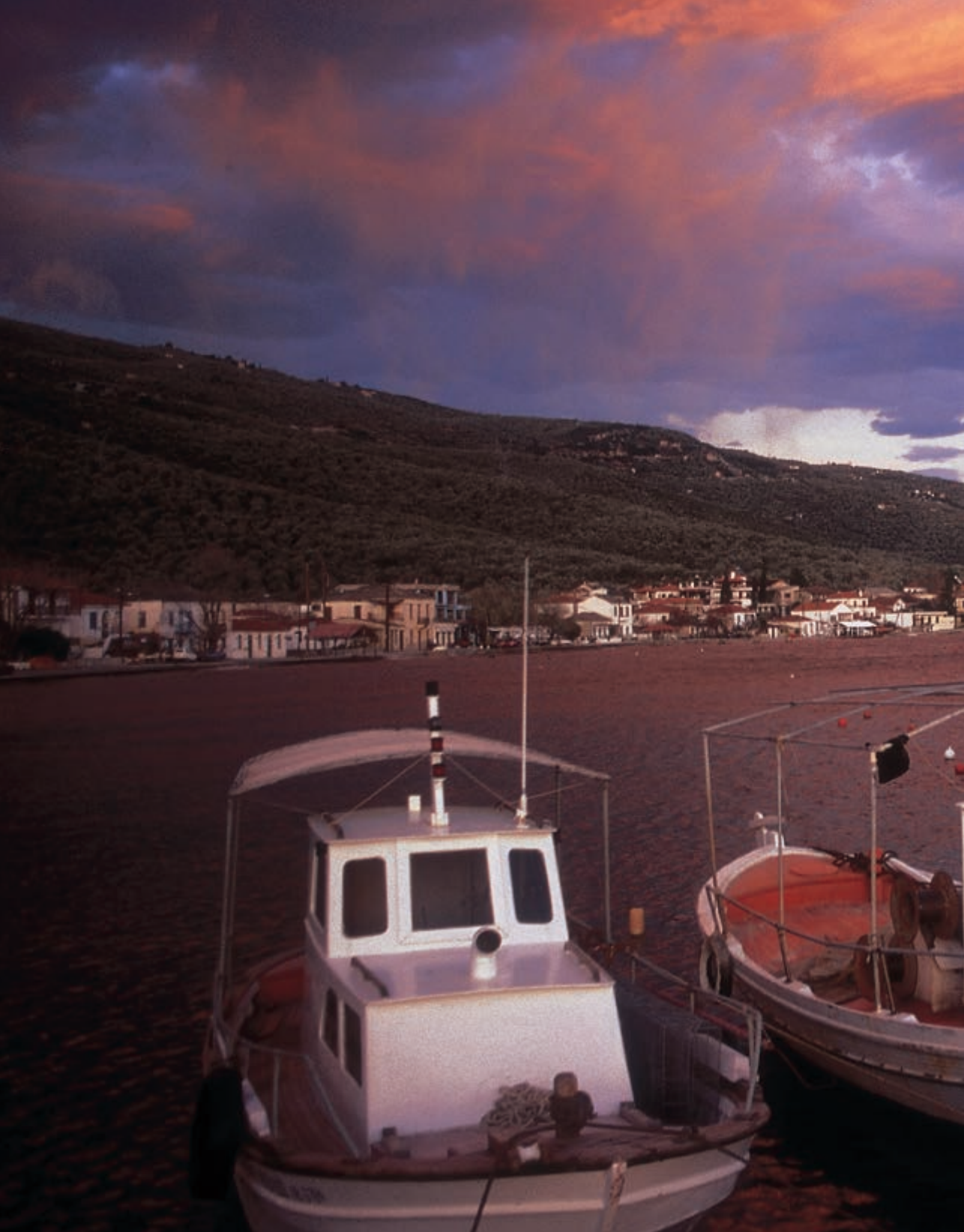
Γραφική εικόνα από το φυσικό λιμανάκι της Γατζέας. Το τοπωνύμιο “Γατζέα” είναι ξενικής του “γάντζωναν” με ασφάλεια τα πλοία,