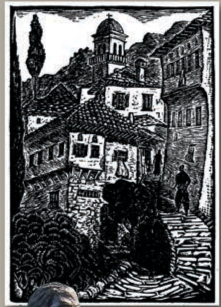
▲ Καλντερίμα στην Μακρονίτσα “ξυλογραφία”

Το μουσείο αυτό, που είναι μοναδικό στο είδος του σ' ολόκληρο τον Θεσσαλικό χώρο, είναι ανοιχτό καθημερινά (πλην Τρίτης) καθ' όλη την θερινή σεζόν (από 10 Μαΐου έως 10