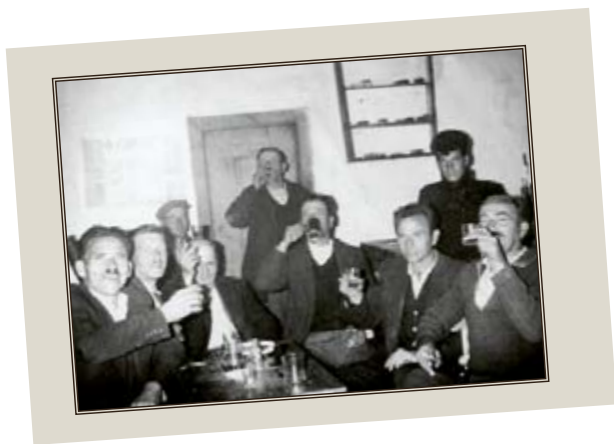
Φωτογραφία των παλιών γλεντζέδων του χωριού στο καφενεδάκι, στα μέσα της δεκαετίας του '50