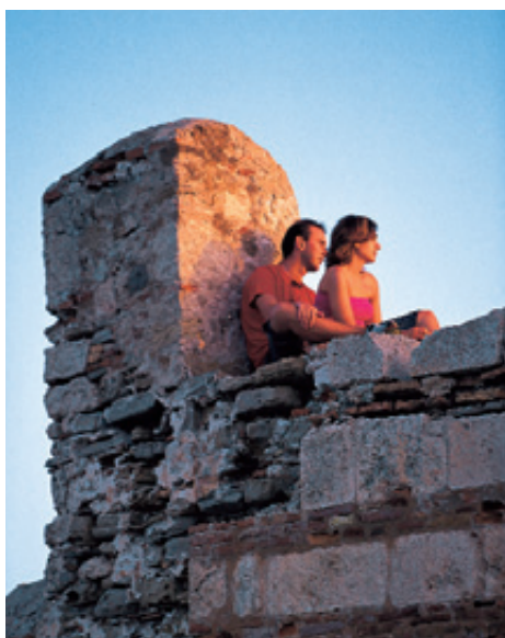
Κορυφαίος τόπος συγκέντρωσης επισκεπτών στο Κάστρο της Μεθώνης είναι το Μπούρτζι

Σήμερα, στα πλαίσια υλοποίησης του προγράμματος "Κάστρων περίπλους", πραγματοποιείται στο κάστρο μια σειρά από στερεωτικές εργασίες σε όλες τις πύλες του, ενώ παράλληλα προβλέπεται και φωτισμός για την