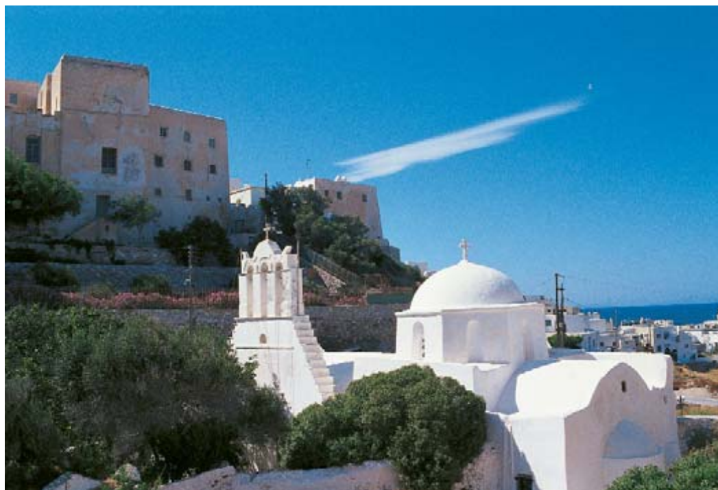
Όψη του Κάστρου από την ανατολική πλευρά. Φαίνεται η Αγία Κυριακή και η εμπορική σχολή, όπου φοίτησε ο Νίκος Καζαντζάκης.

βρίσκουμε στο Κάστρο πολλά ξένα προξενεία, όπως της Αγγλίας, της Ρωσίας, της Ολλανδίας, της Γαλλίας. Σιγά σιγά οι Καθολικοί του Κάστρου, υποτάχθηκαν στους ελληνικούς νόμους διατηρώντας το θρησκευμά τους και την εξουσία της Αρχιεπισκοπής, καθώς και τη δυτική παιδεία και τη γαλλική γλώσσα με τη λειτουργία των δύο σχολείων τους της Γαλλικής Εμπορικής σχολής και της Σχολής Ουρσουλινών. Με το πέρασμα του χρόνου τα πράγματα άρχισαν να αλλάζουν.