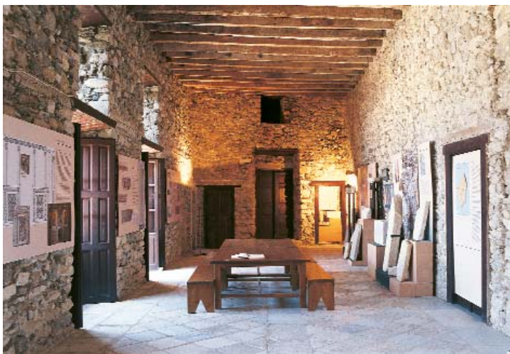
Η κεντρική σάλα του πύργου της Απειραθίτισσας, ή των Κρίσι ή του Γλέζου έγινε βυζαντινό μουσείο.

από κάποιες ανακαινίσεις λόγω των σεισμών πήρε τον οριστικό της χαρακτήρα τον 17ο αιώνα. Κατά τον ιστορικό Ben Slot "η αφθονία του μπαρόκ στο κεντρικό βήμα, αυτή η μεγαλοπρεπής εργασία του 17ου αιώνα, δεν φαίνεται να χρησιμοποιεί παρά ως πλαίσιο αυτής της μαυρισμένης εικόνας, που είναι ίσως αρχαιότερη από την ίδια την εκκλησία. Κάποιοι άλλοι βωμοί δεσπόζουν από εικόνες ή πίνακες του 4' τετάρτου του 17ου αιώνα. Η ανάμιξη των βυζαντινών και δυτικών ρυθμών σε τρεις από αυτές δείχνει καθαρά ότι βγήκαν από την ίδια Βενετο-Κρητική κουλτούρα, από την οποία βγήκε και ο Γκρέκο. Είναι πρωτεύοντα έργα