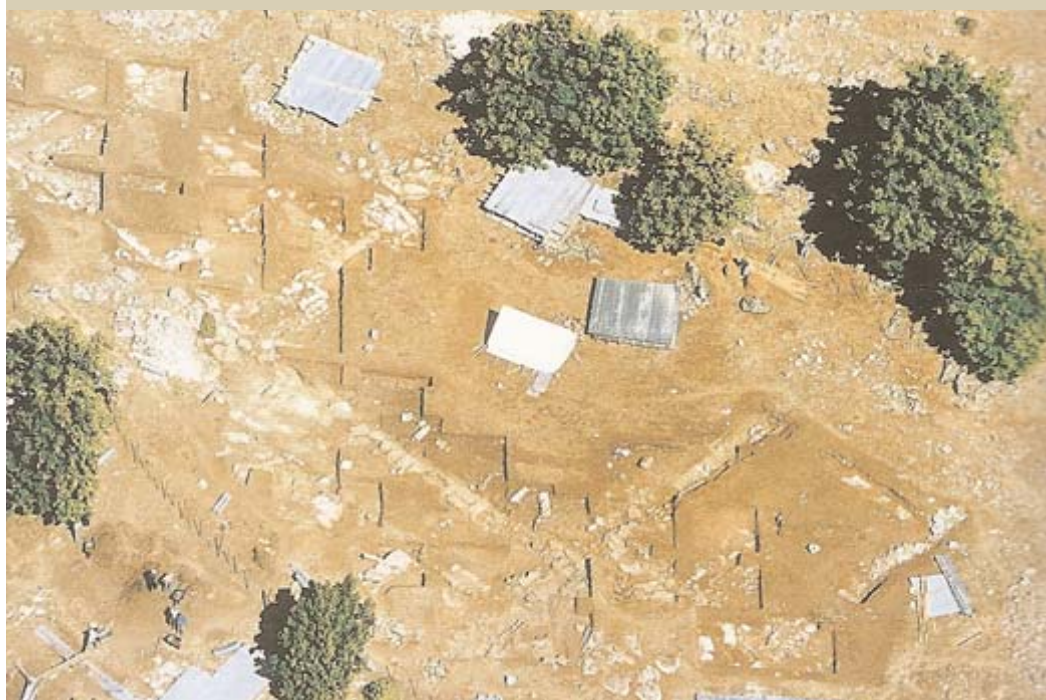
ΦΩΤ. ΑΡΧΕΙΟ ΑΝΑΣΚΑΦΗΣ ΚΑΣΤΡΙΟΥ

Άποψη της θέσης Καστρί από ΝΔ. Φαίνεται η θέση της ακρόπολης και της ανασκαφής. Γενική άποψη της ανασκαφής. Στην αριστερή πλευρά της εικόνας αναγνωρίζονται τα θεμέλια του ναού της ακρόπολης.