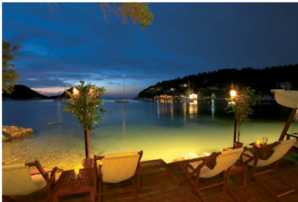
Λάκκα by night.