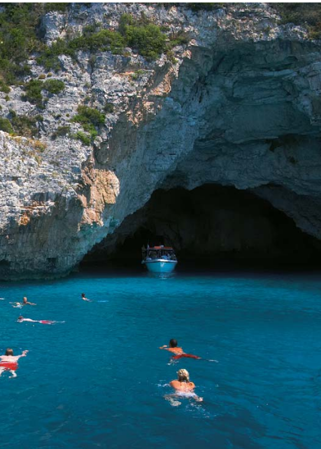
Θαλάσσιες σπηλιές (γράβες) στη δυτική πλευρά των Παξών.