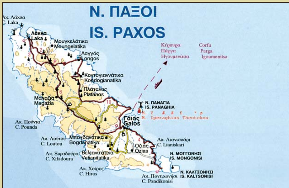
Τμήμα από τον χάρτη "ΙΟΝΙΑ ΝΗΣΙΑ" 1 : 150.000 των εκδόσεων Road.

ΠΩΣ ΘΑ ΠΑΤΕ : Με φέρον από την Ηγουμενίτσα. Με δελφίνο από την Κέρκυρα. Με υδροπλάνο από την Πάτρα, την Κέρκυρα ή τα Γιάννενα. Με τουριστικό ή συμβατικό πλοιάριο από τα Σύβοτα.