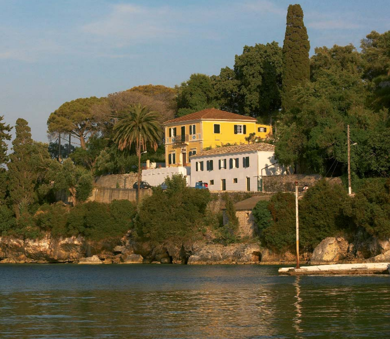
Το σπίτι του Ανεμογιάννη στο Λογγό.

Αυτοκρατορικοί Γάλλοι επιβάλλονται ξανά και τιμωρούν σκληρά τους επαναστάτες. Το 1814 ο Αγγλικός στρατός με ταγματάρχη τον Θεόδωρο Κολοκοτρώνη αποβιβάζεται στους Παξούς και καταλαμβάνει το κάστρο του Άη Νικόλα στον Γάη. Οι Άγγλοι παραχωρούν Σύνταγμα ( 1817 ) και τα Επάνησα αποτελούν το Ενωμένο Κράτος των Ιονίων Νήσων κάτω από την προστασία τους. Οι Παξινοί λαμβάνουν μέρος στην Ελληνική Επανάσταση, παρόλο που το καθεστώς προστασίας το απαγορεύει