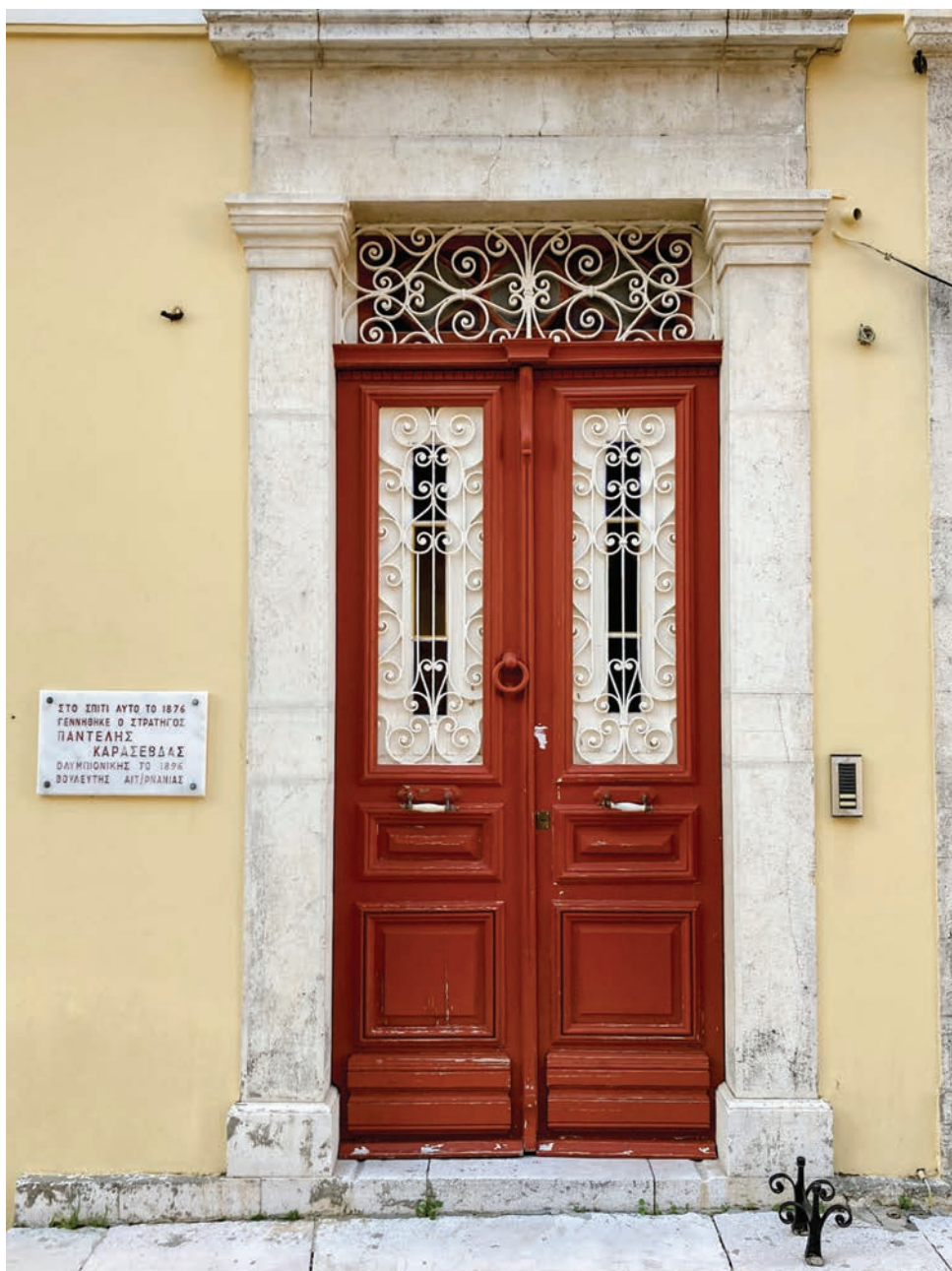
Νεοκλασικό Καρασεβδά. Διατηρητέο από το 1988.

αναγνώστη του παράξενου τοπίου σε μια ξερή και δύσκολη ζώνη, που περιβάλλεται από ένα ιδιαίτερο φυσικό, ορεινό ανάγλυφο. Του αποκαλύπτει επίσης ένα εξαιρετικά πρωτότυπο επιθαλάσσιο περιβάλλον, που το διακοσμούν 20 ακατοίχτες βραχονησίδες, οι Εχινάδες νήσοι, οι οποίες φράζουν το