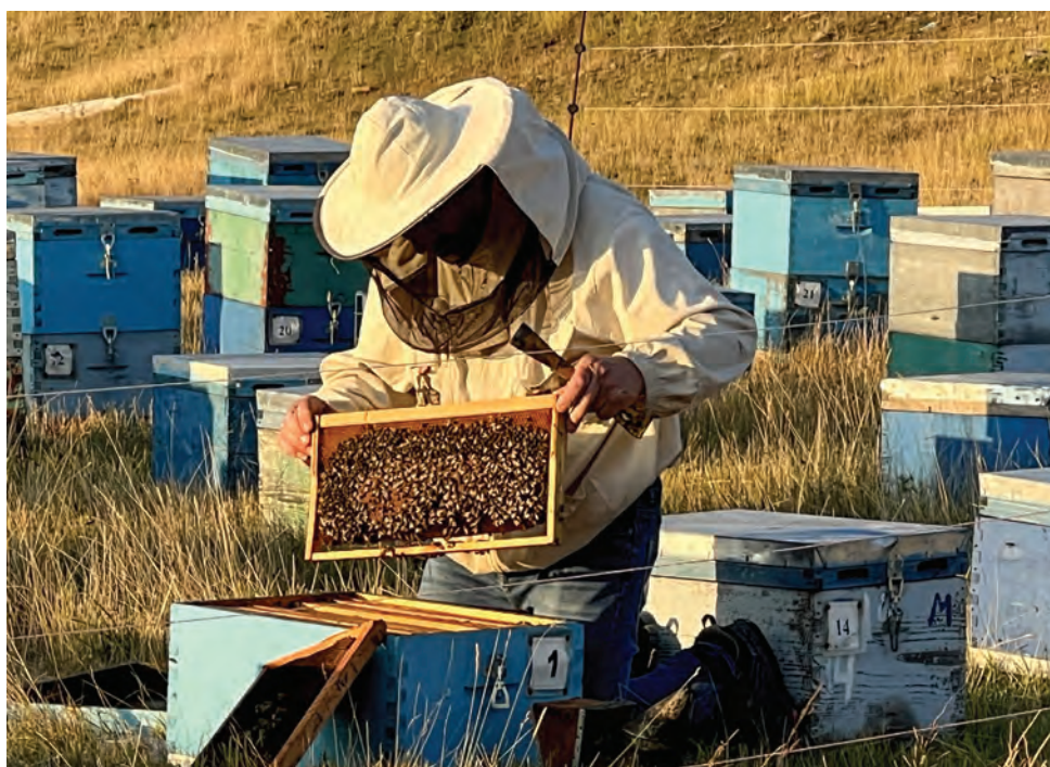
Μελισσοκόμος στα λιβάδια περίξ της λίμνης επί το έργον Ένα λιβάδι όλο μαρούλια στις όχθες της τεχνητής λίμνης