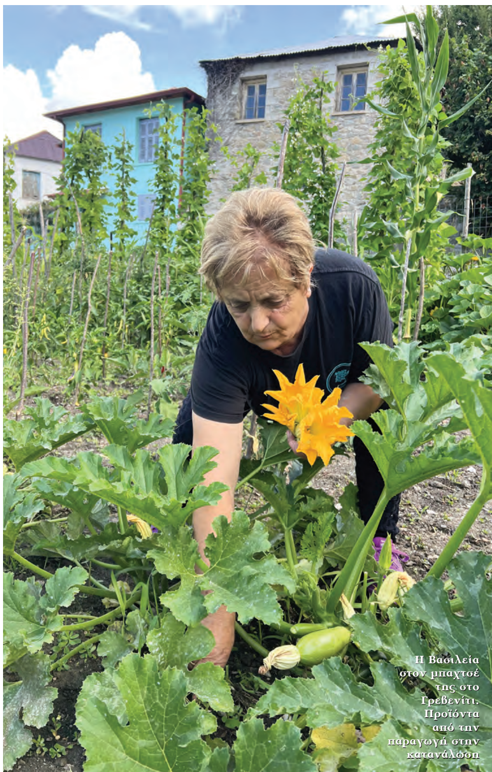
Η Βασιλεία στον μπαχτσέ της στο Γρεβενίτι. Προϊόντα από την παραγωγή στην κατανάλωση