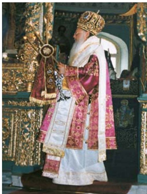
Ο Οικουμενικός Πατριάρχης κ. Βαρθολομαίος με κωδωνίσκους στα άμφια του.

Τ α Τάλαντα και οι Κόπανοι, πού είναι ξύλινα επιμήκη ηχητικά όργανα, κρούονται ρυθμικά και χρησιμοποιούνται κατά περίπτωση στην ορθόδοξη Μοναχική ζωή και Λατρεία παράλληλα με τις Καμπάνες και τα Σήμαντρα.