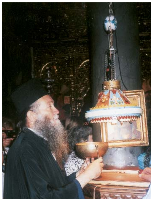
Το κύπημα του Κόντιου κατά την ανάγνωση του Ιερού Ευαγγελίου στην Μονή Αγίου Ιωάννη του Θεολόγου Πάτμου.

σήμαντρα είναι μακρόστενα, ελλειψοειδή, αγωγιδή, ημικυκλικά, κυκλικά κ.α. και είναι σχεδόν πάντα κρεμασμένα σε τοίχους, σε δένδρα, σε κωδωνοστάσια και τα κρούουν με μικρά σιδερένια σφυράκια, ανάλογα με την περίπτωση.