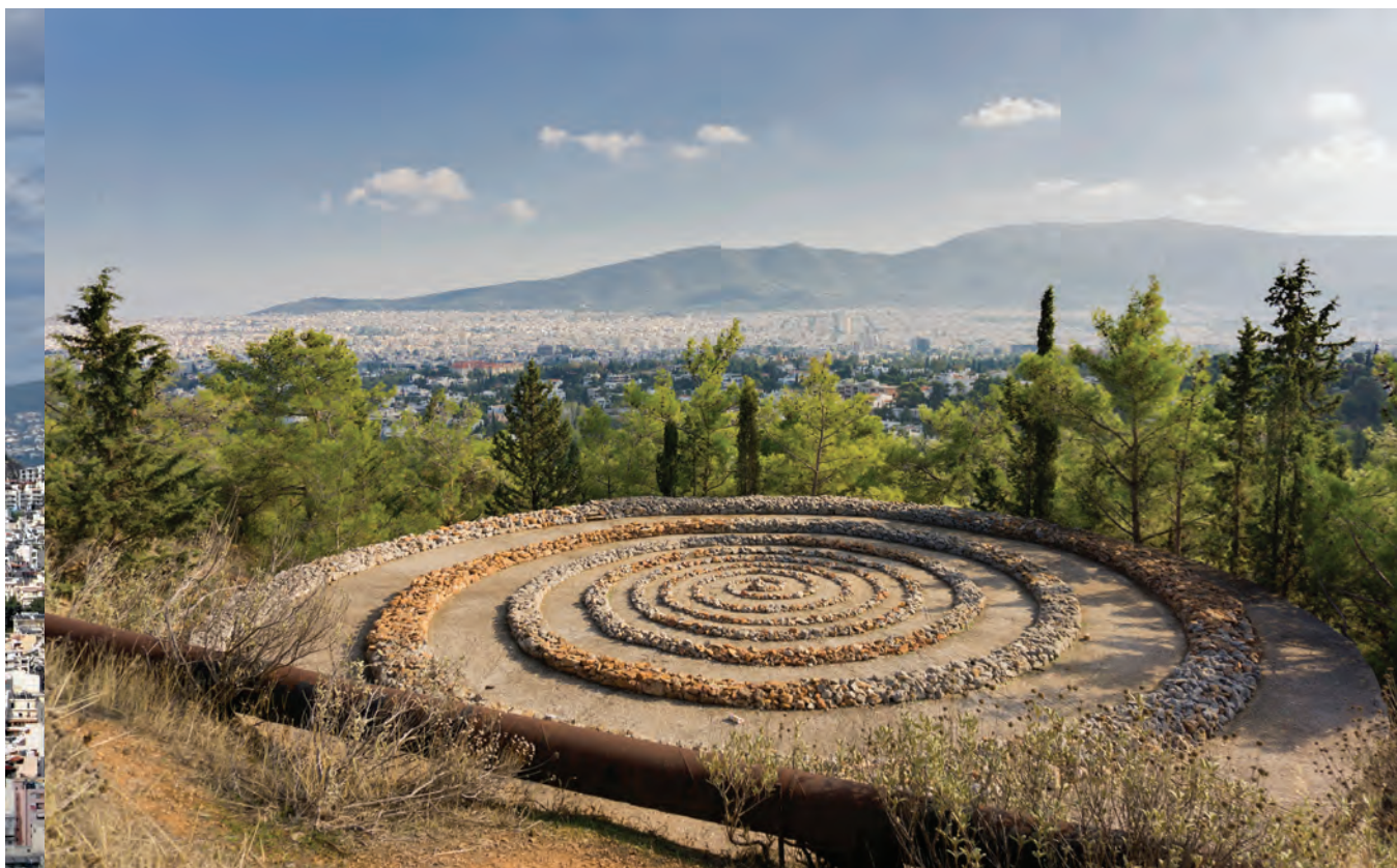
Έργο τέχνης (2001) της Μικαέλας Καραγιάννη στην κορυφή δεξαμενής νερού στον λόφο Φιλοθέης (Τουρκοβούνια)

αγροτόσπιτα του οικισμού Γεώργιου Παπανδρέου στο νότιο πλάτωμα της λοφοσειράς και φτάνω κατάκοπος στο τέρμα του δρόμου, στο υψηλότερο φυσικό παρατηρητήριο της Αθήνας. Σύμφωνα με τον μύθο, από εδώ ο Δίας, ο πατέρας των θεών, έριχνε στους ανθρώπους τις αστραπές και τις βροντές, εικόνα που έρχεται σε αντίθεση με το αποψινό δειλινό το οποίο προμηνύεται γλυκό, χωρίς καμιά υπόνοια άστατου καιρού. Ολόγυρά μου αρχίζουν δειλά δειλά να ανάβουν τα φώτα της πόλης και των μνημείων της, ενώ ο καθαρός ουρανός αντανακλά το είδωλο μιας αεικίνητης Αθήνας. Λίγο πριν ξεκινήσει η «δύση» μου προς το διαμέρισμα της Κυψέλης, θυμάμαι την «εικόνα» του Γαλλοελβετού αρχιτέκτονα Le Corbusier (1887-1965) για την Αττική, ο οποίος σε ένα