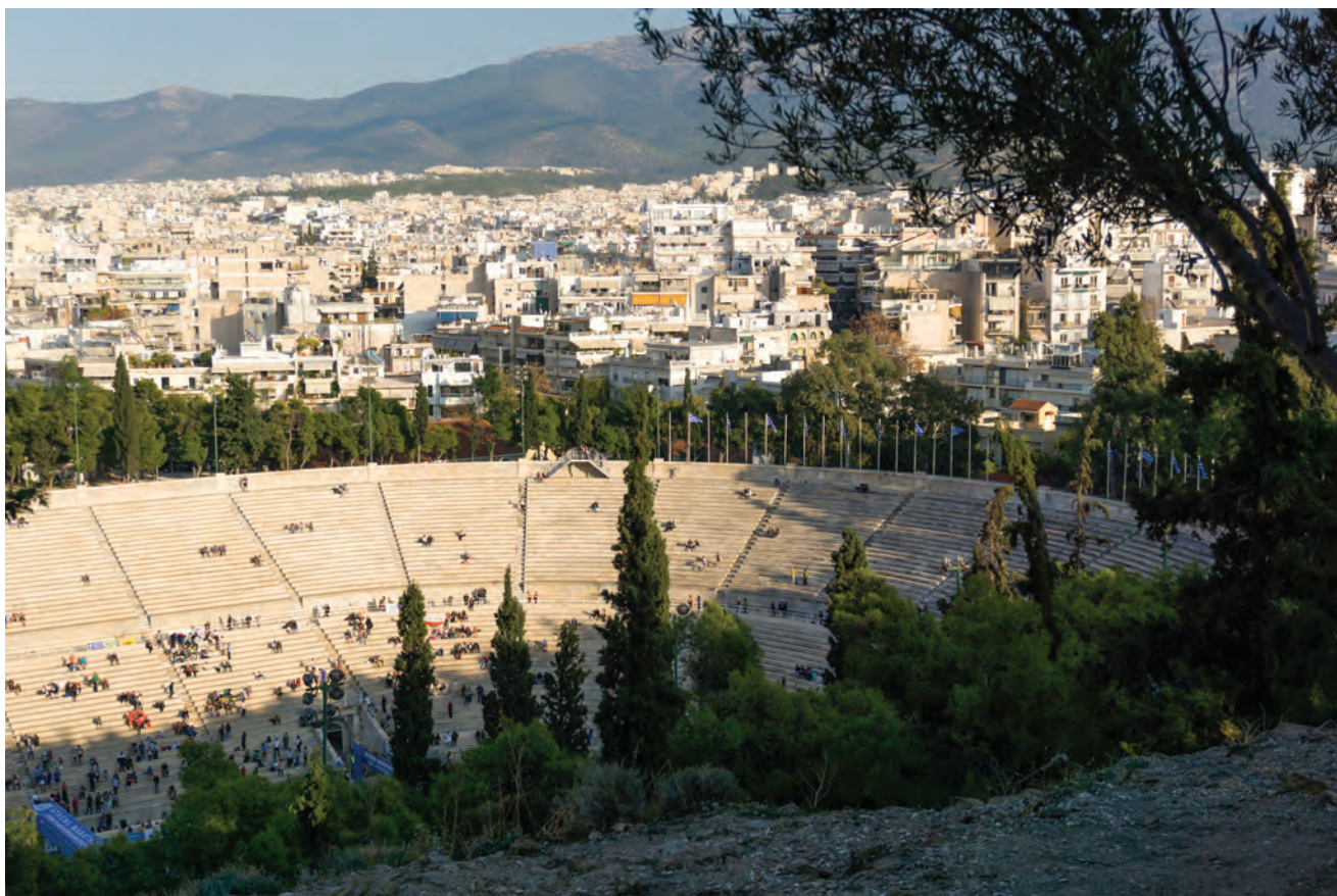
Άποψη του Παναθηναϊκού Σταδίου (Καλλιμάρμαρο) που κείται μεταξύ των λόφων Αρδηπτού και Άγρα

πευκόφυτους λόφους Αρδηπτού και Άγρα, ανάμεσα στους οποίους κείται το Παναθηναϊκό Στάδιο (Καλλιμάρμαρο), στον χώρο όπου τελούνταν κατά την αρχαία εποχή οι γυμνικοί αγώνες των Μεγάλων Παναθηναίων (προς τιμήν της θεάς Αθηνάς) και όπου τελέστηκαν το 1896 οι πρώτοι σύγχρονοι Ολυμπιακοί Αγώνες.