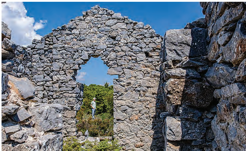
Τα ερείπια του τυροκομείου Ι. Δροσοπούλου Ξωκλήσι Ζωοδόχου Πηγής με κατάλοιπα βυζαντινού ναού

ερχόμαστε από τη Μαγνησία, αποκαλύπτονται ένα ένα τα υπέροχα έργα της μεγαλειώδους πελασγικής φύσης. Περάσαμε κάποιες κοινές ρεματιές, όχτους