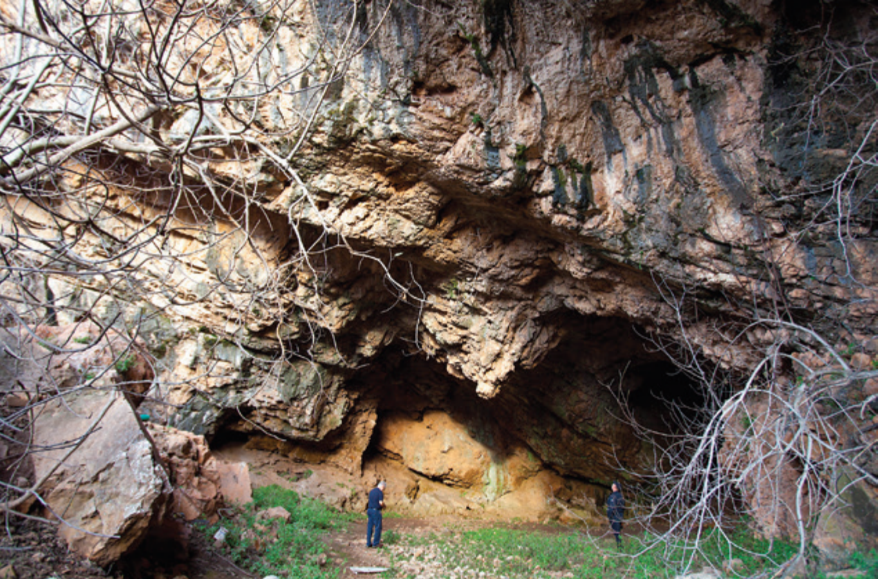
Στην είσοδο της Μεγάλης Καταβόθρας της μεγαλύτερης διαφυγής νερών της αρχαίας λίμνης Κωπαΐδας.