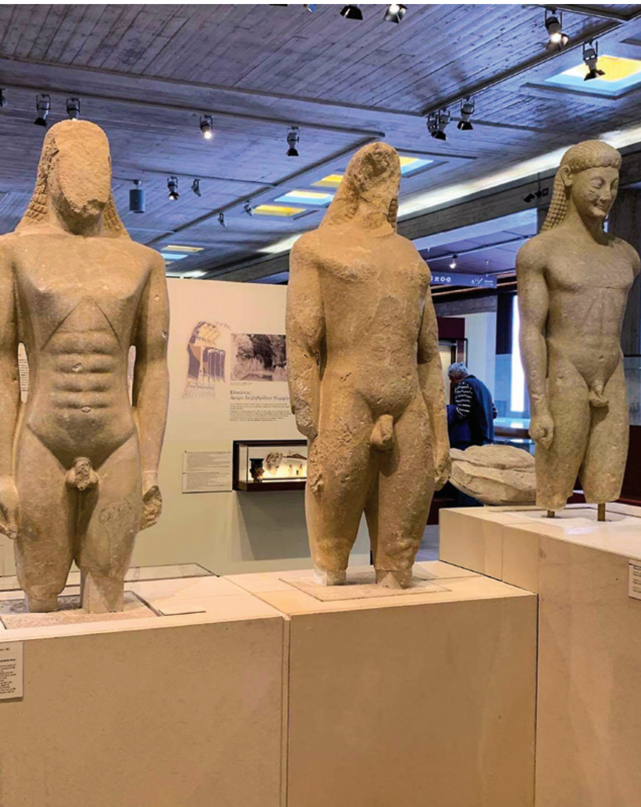
Κούροι από το Ναό και Μαντείο του Πτώου Απόλλωνα στο Αρχαιολογικό Μουσείο Θηβών.