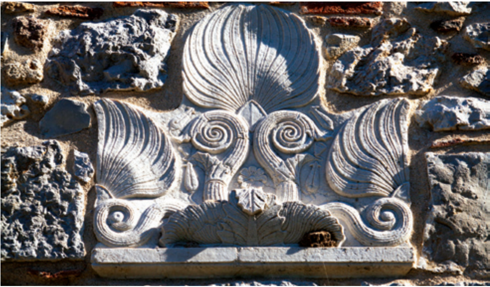
Εξαιρετική λιθανάγλυψη δημιουργία, εντοιχισμένη στην εξωτερική τοικοποιία του Αγίου Γεωργίου.

τες αποκαλύπτονται λίγο νοτιώτερα, και συγκεκριμένα, στο λόφο Βίγλιζα ή Σκοπιά . Εκεί είναι έκδηλη η παρουσία του παρελθόντος, σε δύο σημεία του λόφου και σε δύο διαφορετικές χρονικές περιόδους. Έτσι, στα ψηλώματα του λόφου, σώζονται τμήματα της ακρόπολης της αρχαίας Ακραιφίας , ενώ στους πρόποδες του ίδιου λόφου κάνει την εμφάνισή του το μεσαιωνικό παρελθόν του τόπου. Είναι ο περίφημος Ναός του Αγίου Γεωργίου , του 14ου αιώνα .